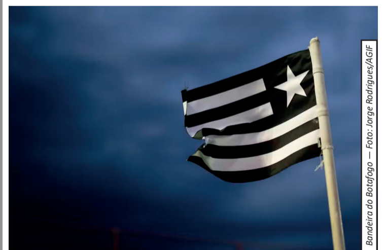
Bandeira do Botafogo

A Fifa suspendeu mais uma sanção de transfer ban aplicada ao Botafogo. A decisão, divulgada nesta sexta-feira (3), retira temporariamente a punição relacionada à dívida do clube com o Zenit, referente à contratação do atacante Artur. O caso diz respeito a parcelas em aberto da negociação, que somam 5,7 milhões de euros (cerca de R$ 34,1 milhões), divididas em três pagamentos de 1,9 milhão de euros (aproximadamente R$ 11,4 milhões). O jogador atualmente está emprestado pelo Botafogo ao São Paulo. Esta é a segunda decisão recente da entidade envolvendo o clube. Na última segunda-feira, a Fifa já ha-