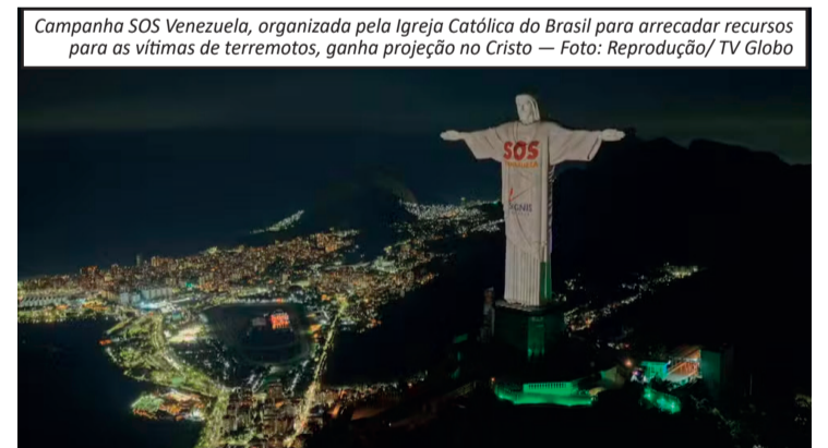
Campanha SOS Venezuela, organizada pela Igreja Católica do Brasil para arrecadar recursos para as vítimas de terremotos, ganha projeção no Cristo

os dois tremores provocaram o desabamento de prédios, destruíram casas e deixaram um cenário de devastação na capital venezuelana e em municípios vizinhos. Segundo autoridades venezuelanas, os abalos foram os mais fortes registrados no país em mais de 100 anos. De acordo com o balanço mais recente divulgado pelo governo da Venezuela, 2.595 pessoas morreram em consequência da tragédia. Já a Organização das Nações Unidas (ONU) esti-