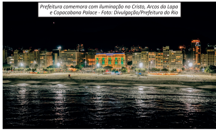
Prefeitura comemora com iluminação no Cristo, Arcos da Lapa e Copacabana Palace

do século XVIII. O título foi concedido em 2012, durante a 36ª Sessão do Comitê do Patrimônio Mundial da Unesco, realizada em São Petersburgo, na Rússia. A candidatura foi coordenada pelo Instituto do Patrimônio Histórico e Artístico Nacional (Iphan), com participação da Prefeitura do Rio, do Governo do Estado e do Instituto Chico Mendes de Conservação da Biodiversidade (ICMBio). Além da Paisagem Cultural Carioca, o Rio de Janeiro possui outros dois patrimônios mundiais reconhecidos pela Unesco: o Cais do Valongo, inscrito em 2017 por sua relevância histórica para a memória da escravidão nas Américas, e o Sítio Roberto Burle Marx, reconhecido em 2021 como Paisagem Cultural por sua contribuição à arquitetura paisagística e ao conceito de jardim tropical moderno.