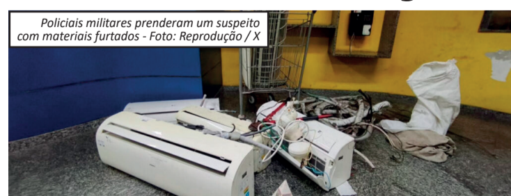
Policiais militares prenderam um suspeito com materiais furtados

evaporadoras de ar-condicionado, três chuveiros, uma tesoura para corte de vergalhão e um carrinho de supermercado. De acordo com a polícia, os equipamentos pertencem ao Conselho Regional de Farmácia. Ainda não há informações sobre quando o furto ocorreu. As autoridades destacam que evaporadoras de ar-condicionado e chuveiros costumam ser alvo de criminosos por conterem