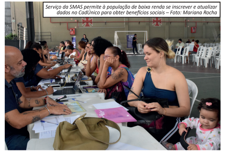
Serviço da SMAS permite à população de baixa renda se inscrever e atualizar dados no CadÚnico para obter benefícios sociais

fissional oferecidos pela Firjan SENAI. Entre as opções estavam formações voltadas para diferentes áreas do mercado de trabalho. Criado para ampliar o acesso da população aos serviços de assistência social, o CadMóvel Carioca leva o atendimento a regiões de maior vulnerabilidade e facilita o acesso a benefícios como Bolsa Família, ID Jovem e Tarifa Social de Energia Elétrica. Desde o lançamento do programa, em abril de 2025, já foram realizados 42 mutirões em diferentes regiões da cidade, beneficiando 5.913 famílias. Durante a ação em São Januário, também foram disponibilizados serviços da Receita Federal, como emissão de segunda via