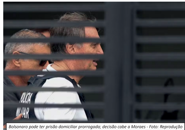
Bolsonaro pode ter prisão domiciliar prorrogada; decisão cabe a Moraes

A defesa do ex-presidente Jair Bolsonaro informou ao Supremo Tribunal Federal que ele não tem interesse em reaver a pistola apreendida durante uma blitz da Polícia Militar do Distrito Federal e voltou a solicitar a prorrogação da prisão domiciliar por razões de saúde.