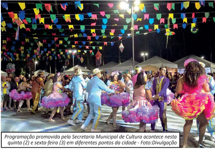
Programação promovida pela Secretaria Municipal de Cultura acontece nesta quinta (2) e sexta-feira (3) em diferentes pontos da cidade