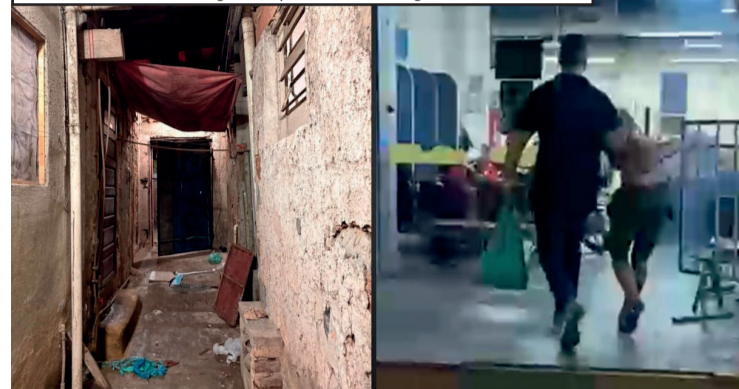
Imóvel adaptado para dificultar a ação policial funcionava próximo a uma escola e armazenava grande quantidade de drogas

Os dois suspeitos foram autuados por tráfico de drogas e encaminhados ao sistema prisional. A Polícia Civil informou que as investigações continuam para identificar outros envolvidos na atuação da organização criminosa na região.