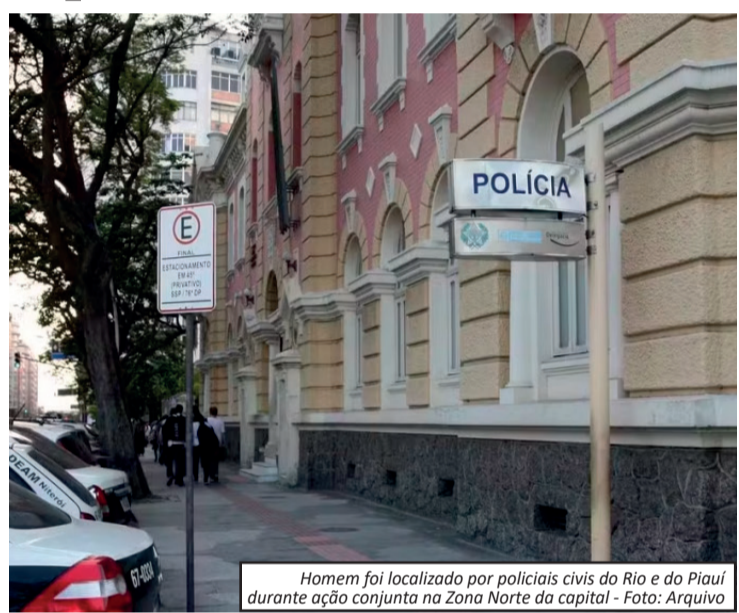
Homem foi localizado por policiais civis do Rio e do Piauí durante ação conjunta na Zona Norte da capital

Após ser localizado e detido, o investigado foi encaminhado para os procedimentos de praxe e permanecerá à disposição da Justiça. Até o momento, a Polícia Civil não divulgou detalhes sobre a investigação nem informou quais serão os próximos desdobramentos do caso.