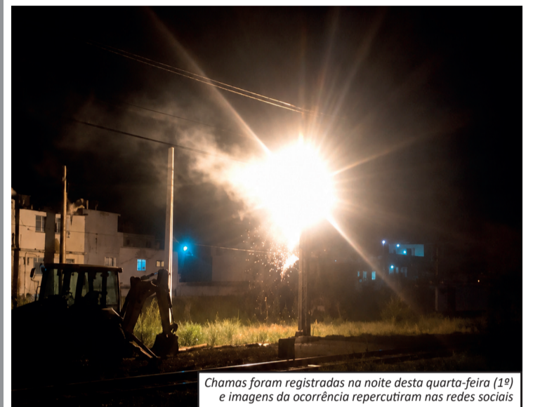
Chamas foram registradas na noite desta quarta-feira (1º) e imagens da ocorrência repercutiram nas redes sociais

Um incêndio registrado na noite desta quarta-feira (1º) na estação ferroviária de Engenheiro Pedreira, em Japeri, provocou momentos de apreensão entre passageiros que estavam no local. As chamas puderam ser vistas à distância e rapidamente ganharam repercussão nas redes sociais por meio de vídeos gravados por testemunhas. As equipes responsáveis foram acionadas para controlar