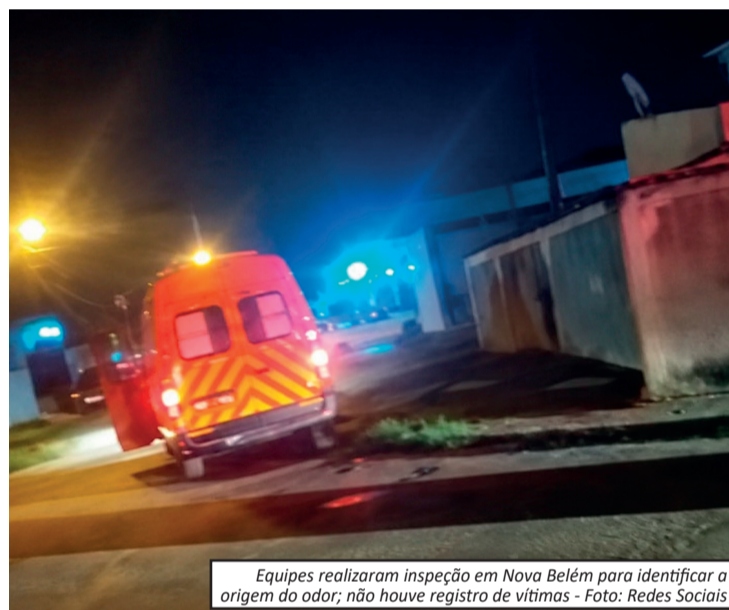
Equipes realizaram inspeção em Nova Belém para identificar a origem do odor; não houve registro de vítimas - Foto: Redes Sociais

As circunstâncias que provocaram o forte odor ainda serão apuradas. Em casos semelhantes, a recomendação é evitar qualquer fonte de ignição, como fósforos, isqueiros e aparelhos elétricos, além de acionar imediatamente o Corpo de Bombeiros para que a situação seja avaliada com segurança.