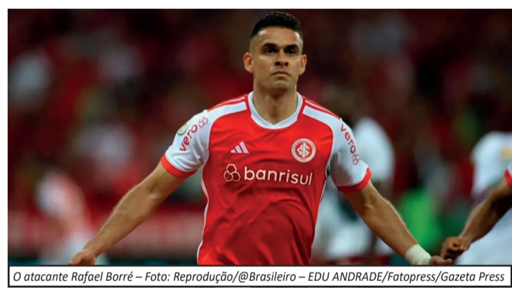
O atacante Rafael Borré

cante teve uma passagem de oscilações no Inter. Foi importante em jogos grandes, especialmente em clássicos Gre-Nal, e chegou a viver boa fase na arrancada do time no Brasileiro de 2024. No entanto, perdeu espaço ao longo da última temporada e deixou de ser presença constante entre os titulares. Ao todo, somou 105 partidas pelo clube, com 28 gols marcados e nove assistências. Em 2026, encerra sua passagem como artilheiro da equipe na temporada, com nove gols em 28 jogos disputados.