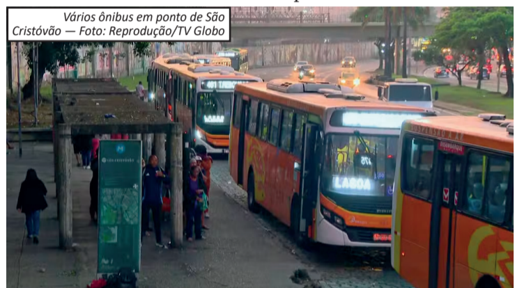
Vários ônibus em ponto de São Cristóvão

De acordo com a Prefeitura do Rio, 98% da frota de ônibus convencionais e 100% dos veículos do BRT estavam em operação no início do dia. A paralisação, que durou três dias, havia reduzido significativamente a circulação do transporte público na cidade.