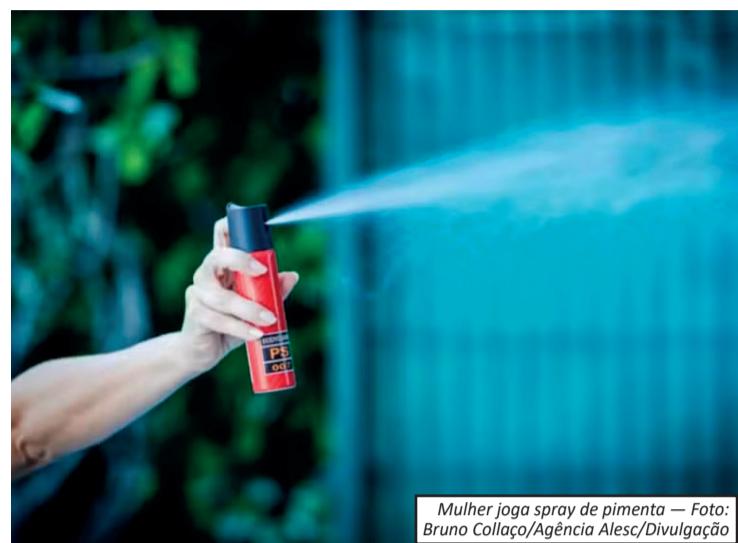
Mulher joga spray de pimenta — Foto: Bruno Collaço/Agência Alesc/Divulgação

O Senado Federal aprovou na terça-feira (30) o Projeto de Lei 727/2026, que autoriza a comercialização, a compra e a posse de aerossol à base de extratos vegetais para uso de defesa pessoal por mulheres. A proposta segue agora para sanção presidencial. A votação ocorreu de forma simbólica e o texto também estabelece normas para o comércio, uso e fiscalização do produto, além de prever penalidades administrativas em casos de