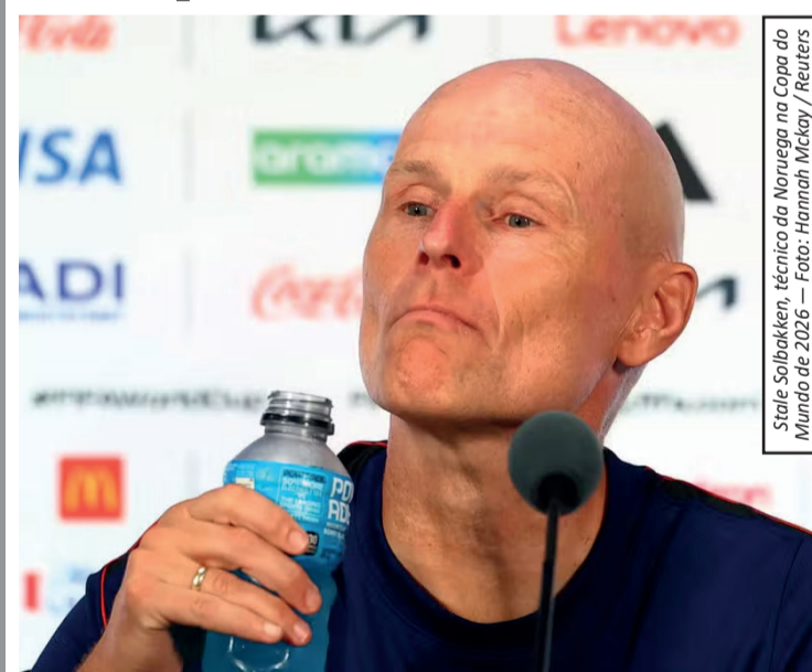
Ståle Solbakken, técnico da Noruega na Copa do Mundo de 2026

O técnico da seleção da Noruega, Ståle Solbakken, adotou um tom provocativo após a vitória por 2 a 1 sobre a Costa do Marfim e mandou um recado direto ao técnico da seleção brasileira, Carlo Ancelotti, durante discurso no vestiário. Em meio à celebração da classificação para as oitavas de final da Copa do Mundo, Solbakken exaltou o desempenho da equipe e afirmou que o momento representa um marco histórico para o futebol do país, que voltou ao Mundial após 28 anos de ausência.