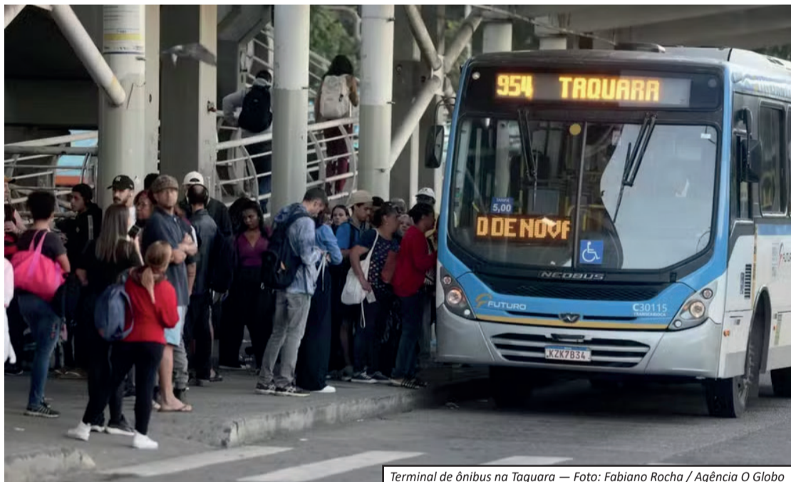
Terminal de ônibus na Taquara — Foto: Fabiano Rocha / Agência O Globo

Os rodoviários reivindicam: • Reajuste salarial de 17%; • Piso de R$ 5 mil para motoristas do BRT e R$ 4 mil para os demais motoristas; • Vale-alimentação de R$ 1 mil; • Plano de saúde; • Mudanças na escala de trabalho, com jornada de 7h30. As empresas ofereceram reajuste de 4,39% e, até o momento, não apresentaram uma nova proposta. Desde o início da paralisação, na segunda-feira (29), passageiros têm enfrentado longos períodos de espera, superlotação e redução significativa da oferta de ônibus em diferentes regiões da capital fluminense. Além dos transtornos, também foram registrados casos de vandalismo e depredação de coletivos durante os protestos.