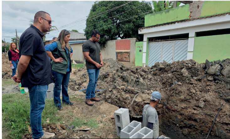
Mais de 400 metros de drenagem já foram concluídos e expectativa é que as ruas contempladas estejam asfaltadas até o fim do ano

“Estamos executando uma obra estruturante, que vai muito além da pavimentação. A drenagem garante que as ruas tenham durabilidade, evita alagamentos e prepara o bairro para receber uma infraestrutura de qualidade, beneficiando os moradores por muitos anos”, explicou.