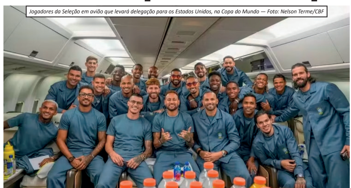
Jogadores da Seleção em avião que levará delegação para os Estados Unidos, na Copa do Mundo

A Seleção Brasileira desembarcou na manhã desta terça-feira (2) em Nova Jersey, nos Estados Unidos, onde dará sequência à preparação para a Copa do Mundo de 2026. A chegada marca o início da reta final de treinamentos antes da estreia da equipe no torneio. Em seu primeiro Mundial