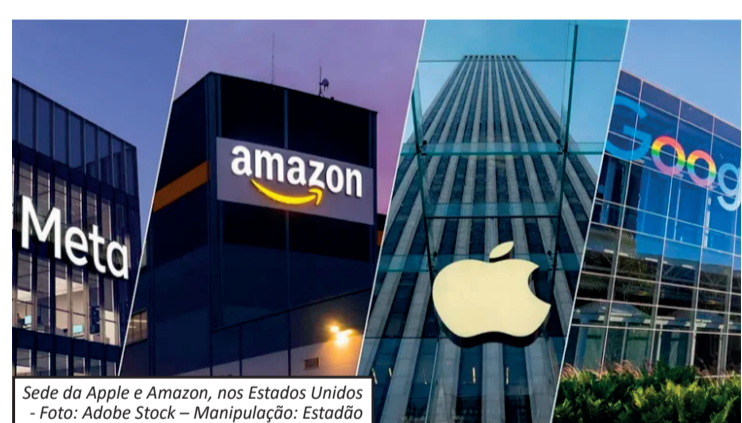
Sede da Apple e Amazon, nos Estados Unidos

O julgamento envolve um dos temas mais sensíveis do ambiente digital brasileiro: a obrigação das plataformas de remover conteúdos considerados ilegais e os riscos de responsabilização das empresas caso não adotem providências após serem notificadas. Inicialmente, a análise ocorreria em plenário virtual, mas acabou retirada da pauta. Agora, os ministros irão debater o tema em sessão presencial, o que deve ampliar as dis-