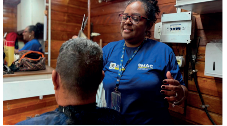
Mensalmente, são realizados mais de 500 atendimentos, beneficiando centenas de pessoas e promovendo inclusão social

Com a combinação de capacitação profissional e atendimento gratuito, o projeto se consolidou como uma das principais ações de inclusão social desenvolvidas pela Prefeitura de Volta Redonda.