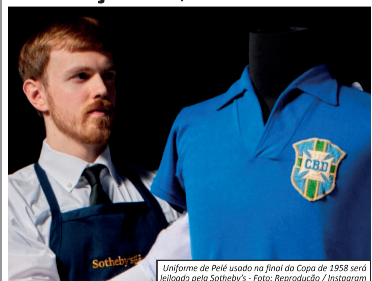
Uniforme de Pelé usado na final da Copa de 1958 será leiloadado pela Sotheby's

Uma das peças mais emblemáticas da história do futebol mundial será colocada à venda nos Estados Unidos. A camisa usada por Pelé na final da Copa do Mundo de 1958, quando o Brasil conquistou seu primeiro título mundial, será leiloadada em Nova York pela tradicional casa Sotheby's. Avaliada em mais de US$ 6 milhões, cerca de R$ 30 milhões na cotação atual, a peça integra a coleção "The Beautiful Game", dedicada a itens históricos do futebol.