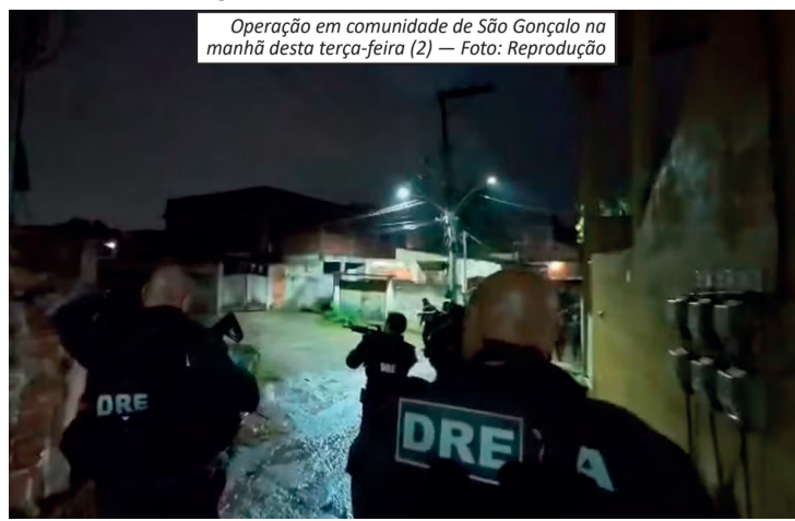
Operação em comunidade de São Gonçalo na manhã desta terça-feira (2)

A Polícia Civil aponta que a ordem para a tortura partiu de lideranças do Comando Vermelho. Um dos suspeitos apontados como mandante cumpre pena no Complexo de Gericinó, enquanto outro seria um dos chefes da facção em liberdade e estaria escondido em uma comunidade da Zona Norte do Rio. O crime ocorreu no dia 18 de maio e, após as agressões, as vítimas foram expulsas da comunidade. Durante a operação desta terça-feira, os agentes apreenderam materiais que podem auxiliar no avanço das investigações, incluindo a máquina utilizada para raspar os cabelos das mulheres. A polícia informou que as diligências continuam para identificar e responsabilizar todos os envolvidos na ação criminosa.