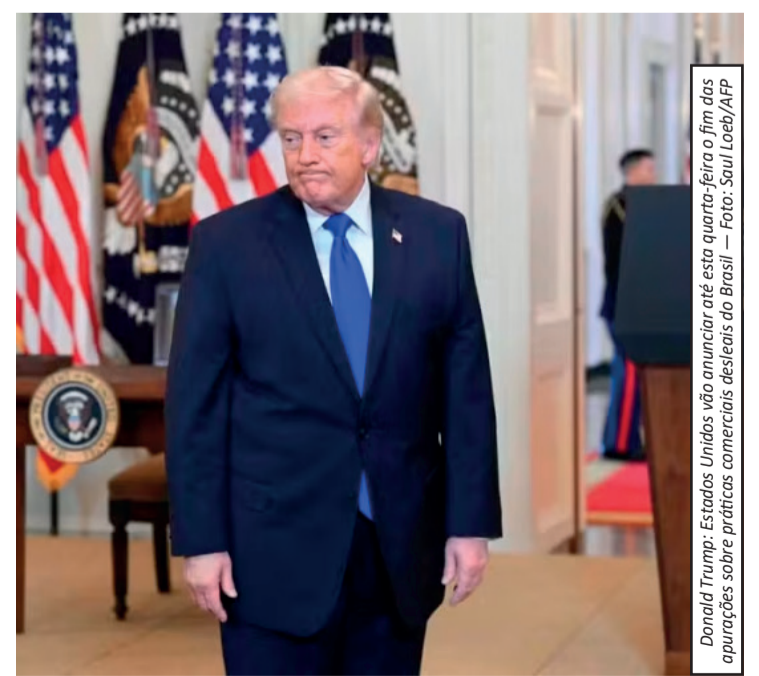
Donald Trump: Estados Unidos vão anunciar até esta quarta-feira o fim das apurações sobre práticas comerciais desleais do Brasil

a aplicação de algumas tarifas comerciais impostas pelo governo americano nos últimos anos. Desde então, Washington tem ampliado o uso de outros instrumentos de pressão comercial para questionar práticas adotadas por parceiros internacionais. O possível anúncio de novas sanções ocorre em um momento de aumento das tensões comerciais entre Brasil e Estados Unidos, após a proposta americana de aplicar uma tarifa adicional de 25% sobre produtos brasileiros, medida que ainda está em fase de consulta pública.