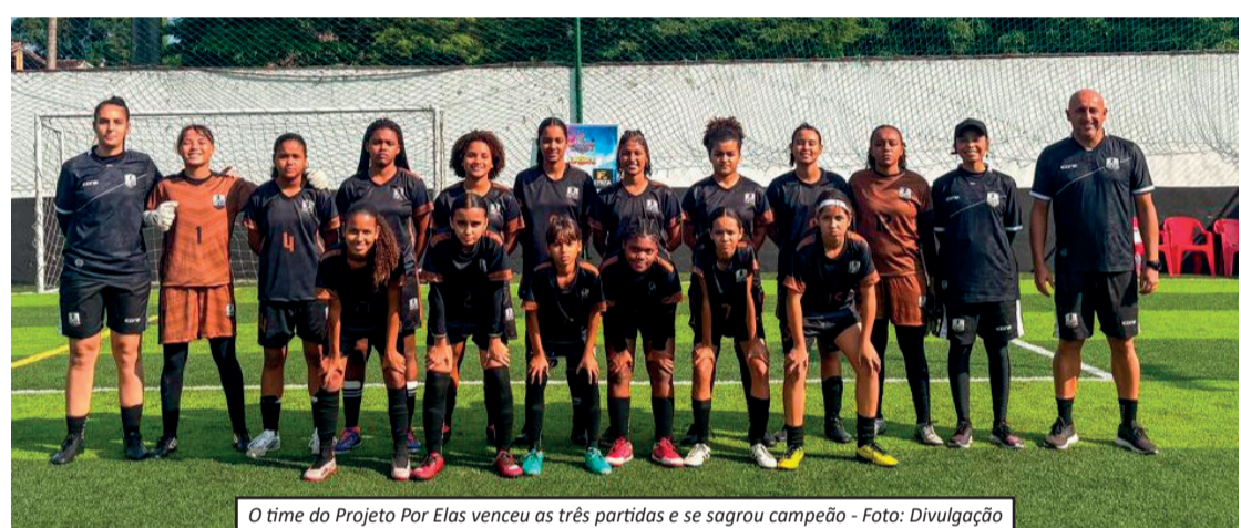
O time do Projeto Por Elas venceu as três partidas e se sagrou campeão

O resultado coroou o trabalho desenvolvido pelo projeto, que oferece estrutura técnica e acompanhamento multidisciplinar às atletas, incluindo suporte físico, médico e social. A comissão técnica destacou o comprometimento das jogadoras e a evolução apresentada ao