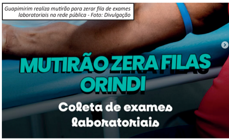
Guapimirim realiza mutirão para zerar fila de exames laboratoriais na rede pública

ma Matrícula Inteligente. A expectativa da Prefeitura é fortalecer a formação educacional da população, ampliando o acesso gratuito ao ensino de línguas estrangeiras e incentivando novas oportunidades acadêmicas e profissionais para os participantes.