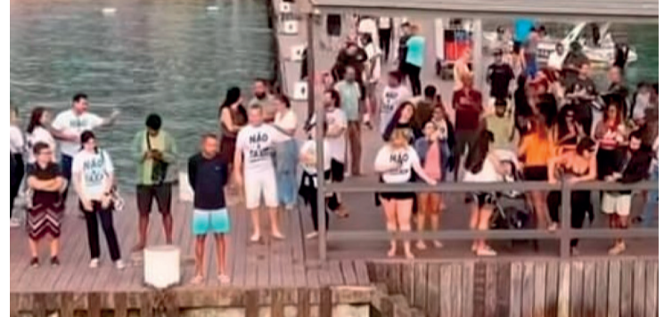
A medida foi adotada de forma preventiva devido às manifestações ocorridas nos últimos dias

A Prefeitura de Angra dos Reis suspendeu temporariamente as aulas em duas unidades de ensino da Vila do Abraão, na Ilha Grande, em razão dos protestos registrados contra o novo Sistema Digital de Turismo implantado pelo município.