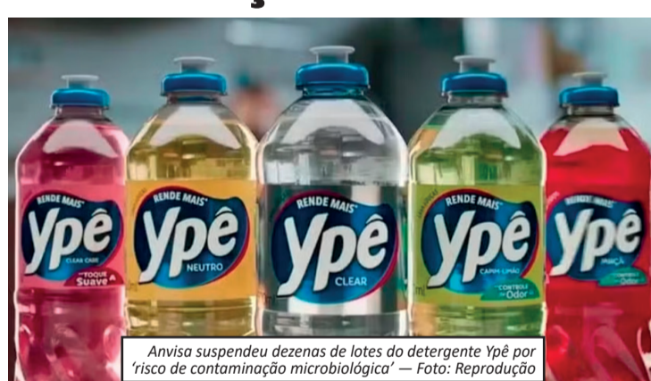
Anvisa suspendeu dezenas de lotes do detergente Ypê por 'risco de contaminação microbiológica'

dades da fábrica. Apesar da decisão, permanecem as restrições para os produtos fabricados até o fim de março. A recomendação da Anvisa continua sendo que consumidores não utilizem esses itens e os mantenham armazenados até a conclusão das análises em andamento. A Ypê informou que segue realizando testes para tentar comprovar a segurança dos lotes afetados e reverter a suspensão aplicada em maio, quando a Anvisa determinou a interrupção da comercialização e o uso de 24 produtos líquidos da marca, entre detergentes, lava-roupas e desinfetantes. Enquanto os estudos são concluídos, a empresa mantém um plano de gerencia-