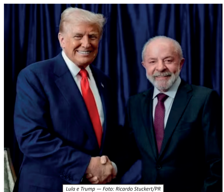
Lula e Trump

O governo dos Estados Unidos anunciou uma proposta para aplicar uma tarifa extra de 25% sobre produtos importados do Brasil. A medida, que ainda está em fase de consulta pública, poderá entrar em vigor a partir de 15 de julho de 2026. A decisão foi baseada em uma investigação conduzida pelo Escritório do Representante Comercial dos Estados Unidos (USTR), iniciada em julho de 2025. Segundo o relatório final, determinadas políticas e práticas adotadas pelo Brasil foram consideradas “irrazoáveis” e prejudiciais ao