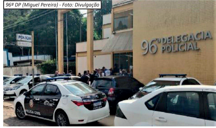
96ª DP (Miguel Pereira)

o Paraguai. Relatórios de inteligência financeira indicaram movimentações milionárias atribuídas a pessoas sem capacidade econômica compatível com os valores registrados. A força-tarefa reúne policiais civis de diferentes estados, com apoio da Coordenadoria de Recursos Especiais (Core) e dos Grupos de Atuação Especial de Combate ao Crime Organizado (Gaeco). O objetivo é identificar todos os integrantes da estrutura financeira da facção, aprofundar a investigação patrimonial e responsabilizar criminalmente os envolvidos.