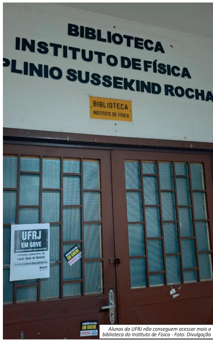
Alunos da UFRJ não conseguem acessar mais a biblioteca do Instituto de Física

Segundo o movimento, muitos universitários dependem do restaurante como principal refeição do dia. Impactos da greve A greve dos técnicos-administrativos também afeta diretamente a rotina acadêmica. Entre os problemas relatados estão bibliotecas fechadas, suspensão de serviços administrativos, dificuldades em matrículas e atrasos em bolsas estudantis. Os organizadores afirmam que a paralisação terá atividades ao longo de todo o dia em diferentes unidades da universidade, incluindo a Cidade Universitária, Praia Vermelha e o Instituto de Filosofia e Ciências Sociais (IFCS). O ato principal está marcado para as 15h, em frente à Reitoria da UFRJ, na Ilha do Fundão. Procurada, a Universidade Federal do Rio de Janeiro informou que ainda não havia se pronunciado sobre as denúncias até a última atualização da reportagem.