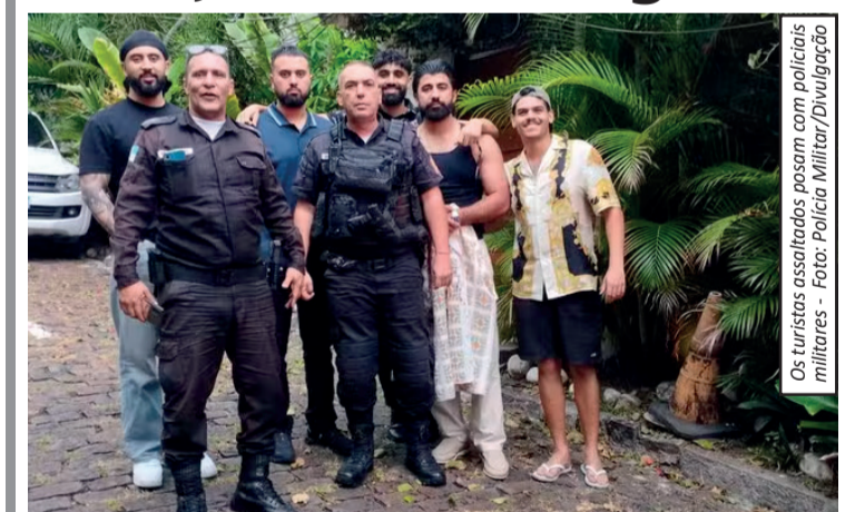
Os turistas assaltados passam com policiais militares

Um grupo de turistas americanos foi assaltado na madrugada desta terça-feira (19), na subida do Elevado Paulo de Frontin, na Região Central do Rio de Janeiro. Durante a ação criminosa, um dos estrangeiros chegou a ser agredido e precisou de atendimento no Hospital Municipal Miguel Couto, na Zona Sul. Segundo relatos, os turistas retornavam da Pedra do Sal, na Zona Portuária, e seguiam de carro em direção a São Conrado quando foram abordados por criminosos armados em motocicletas. Em entrevista ao programa "Balanço Geral", da TV Record, uma das vítimas descreveu o momento do assalto e demonstrou indignação com a situação.