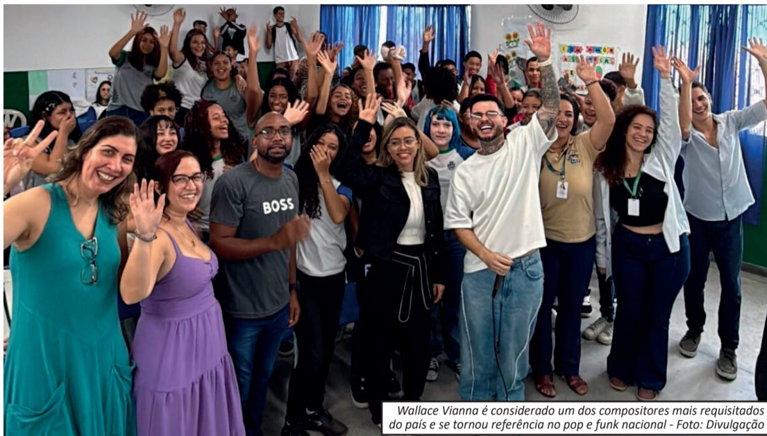
Wallace Vianna é considerado um dos compositores mais requisitados do país e se tornou referência no pop e funk nacional

O produtor musical, compositor e empresário Wallace Vianna emocionou estudantes da rede municipal de ensino de Japeri ao compartilhar sua trajetória de vida e carreira durante encontros promovidos pela Prefeitura, por meio das secretarias municipais de Educação e Cultura. A iniciativa, voltada para alunos do 9º ano e da Educação de Jovens e Adultos (EJA), busca aproximar os jovens de histórias reais de superação, incentivo aos sonhos e transformação por meio da música.