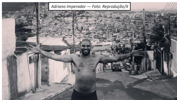
Adriano Imperador — Foto: Reprodução/X

O ex-atacante Adriano Imperador terá sua trajetória retratada nos cinemas. A produtora Boutique Filmes confirmou o desenvolvimento de uma cinebiografia inspirada no livro "Adriano: Meu Medo Maior", lançado em 2024 e escrito pelo jornalista Ulisses Neto em parceria com o ex-jogador. O longa-metragem está em fase inicial de produção e