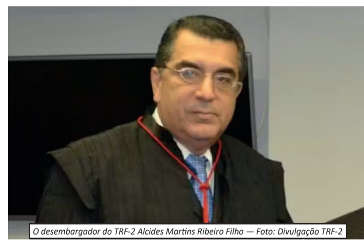
O desembargador do TRF-2 Alcides Martins Ribeiro Filho

nais aparentes de violência. A perícia foi feita pela Delegacia de Homicídios da Capital, e o caso segue sob investigação. O magistrado havia sido visto pela última vez em 14 de abril, após sacar R$ 1 mil e seguir de táxi para a Vista Chinesa. O desaparecimento mobilizou o alto escalão do TRF-2 e reuniões semanais entre o tribunal e investigadores da Polícia Civil.