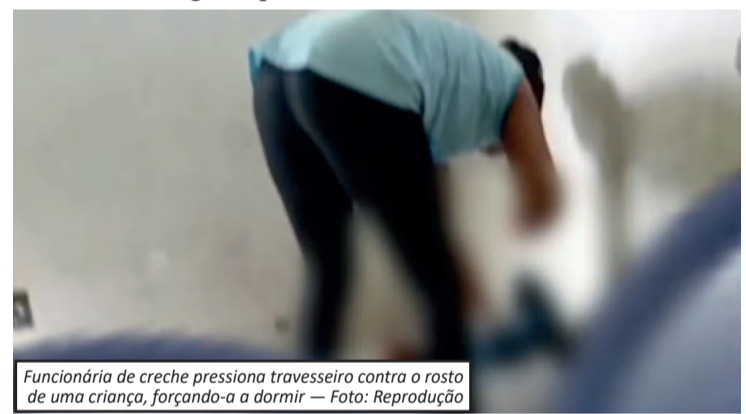
Funcionária de creche pressiona travesseiro contra o rosto de uma criança, forçando-a a dormir