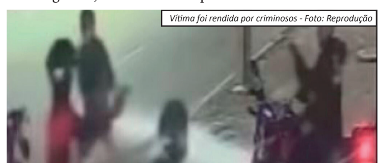
Vítima foi rendida por criminosos

litar, equipes do 18º BPM (Jacarepaguá) foram acionadas para uma ocorrência de encontro de cadáver. Ao chegarem ao endereço, os agentes encontraram a vítima já sem vida e isolaram a área para o trabalho da perícia. O caso foi registrado na Delegacia de Homicídios da Capital (DHC), que realiza diligências para identificar os autores do crime e esclarecer as circunstâncias da execução.