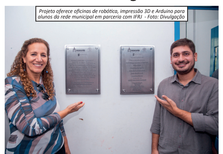
Projeto oferece oficinas de robótica, impressão 3D e Arduino para alunos da rede municipal em parceria com IFRJ

Ciência, Tecnologia e Inovação, Carlos Senna, ressaltou que o Laboratório Maker ajudará a democratizar o acesso às ferramentas tecnológicas, incentivando habilidades como pensamento lógico, resolução de problemas e criatividade. A ação reforça o compromisso da gestão municipal com a modernização do ensino e consolida Paracambi como referência em inovação educacional no estado do Rio de Janeiro.