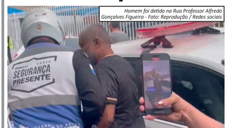
Homem foi detido na Rua Professor Alfredo Gonçalves Figueira

Um homem foi preso em flagrante na segunda-feira (18) acusado de importunar sexualmente uma jovem em Nilópolis, na Baixada Fluminense. Segundo a Secretaria de Estado de Governo do Rio de Janeiro, agentes da Operação Segurança Presente realizavam patrulhamento na região quando foram acionados para atender a ocorrência na Rua Professor