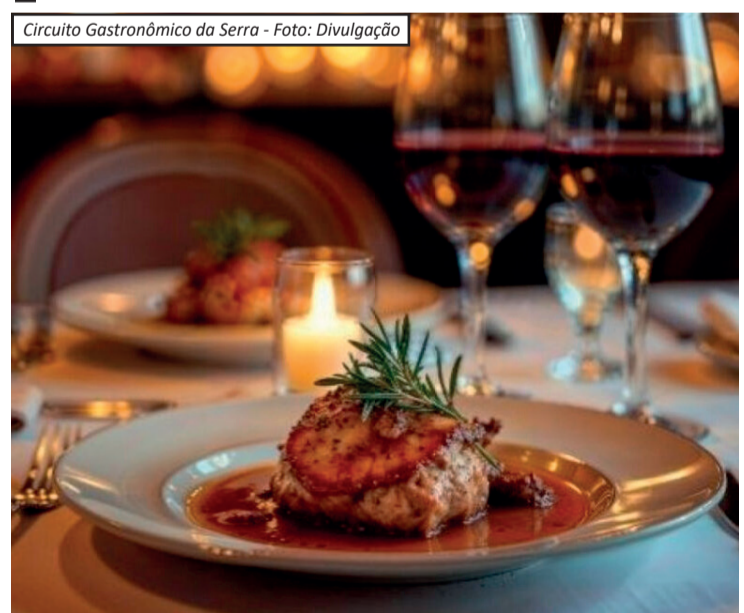
Circuito Gastronômico da Serra

A cidade de Petrópolis vai receber, entre junho e setembro de 2026, o Circuito Gastronômico da Serra, iniciativa que promete movimentar restaurantes e atrair turistas durante a temporada de inverno. O projeto será encerrado com o prêmio “Sabor em Cena”, voltado à valorização da gastronomia local. A programação reúne alguns dos principais restaurantes da cidade em ações integradas ao longo dos próximos meses, incluindo semanas temáticas, experiências gastronômicas, ati-