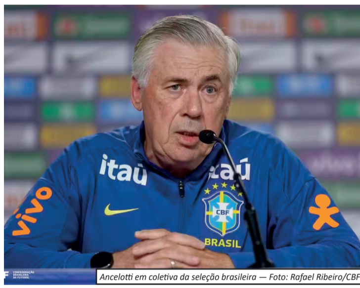
Ancelotti em coletiva da seleção brasileira

após o anúncio oficial, o camisa 10 enviou uma mensagem de agradecimento e celebração ao treinador italiano, com palavras de carinho e emojis de corações verde e amarelo. A relação entre Ancelotti e Neymar, que nos últimos meses vinha sendo tratada de maneira mais distante, voltou a se aproximar às vésperas da Copa do Mundo. O atacante retorna à Seleção após um longo período afastado e aparece como uma das principais apostas do Brasil para a