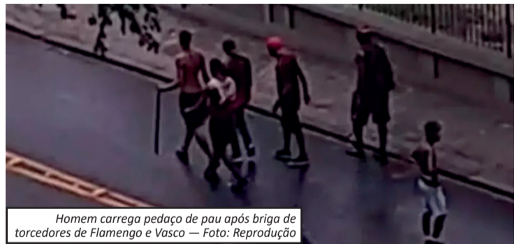
Homem carrega pedaço de pau após briga de torcedores de Flamengo e Vasco

instrumentos musicais e qualquer item que identifique as torcidas nos estádios e no entorno das arenas esportivas em todo o estado. Segundo o MPRJ, relatórios, imagens e registros de ocorrência apontam a participação de integrantes das organizadas em brigas, tumultos e outros atos violentos após o clássico. O órgão afirma ainda que houve descumprimento do Termo de Ajustamento de Conduta (TAC) firmado anteriormente entre as torcidas e as autoridades. O TAC prevê punições como advertências e suspensões em casos de violência ou ameaça à ordem pública, inclusive fora dos