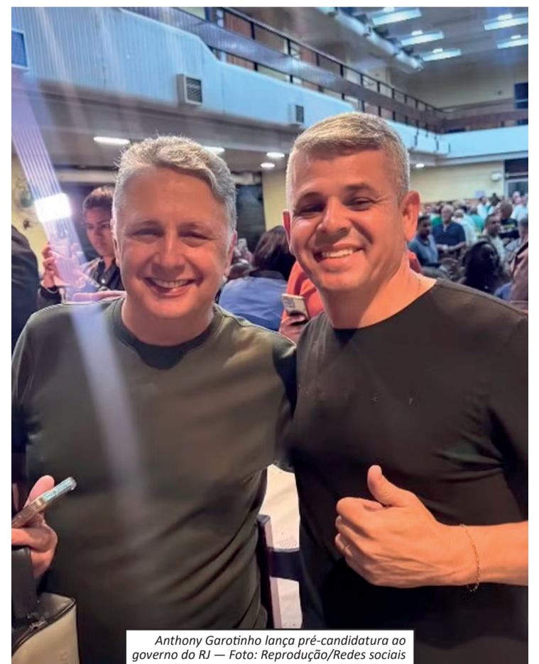
Anthony Garotinho lança pré-candidatura ao governo do RJ

ções criminosas deve ser prioridade absoluta no Rio de Janeiro. Com experiência como governador e também como secretário estadual de Segurança, Garotinho se apresenta como uma liderança capaz de frear o avanço da criminalidade e da corrupção, utilizando sua trajetória política como principal credencial para disputar novamente o comando do Palácio Guanabara. Anthony Garotinho anunciou oficialmente sua pré-candidatura ao Governo do Estado do Rio de Janeiro pelo partido Republicanos. O lançamento movimentou os bastidores políticos fluminenses para as eleições de 2026. Aos 66 anos, Garotinho volta a se colocar na disputa pelo Palácio Guanabara após uma longa trajetória política. Ele já foi prefeito de Campos dos Goytacazes, deputado estadual, deputado federal e governador do Rio entre 1999 e 2002. Em