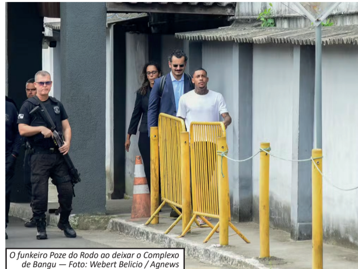
O funkeiro Poze do Rodo ao deixar o Complexo de Bangu — Foto: Weibert Belício / Agnews

O cantor MC Poze do Rodo foi solto no início da tarde desta quinta-feira (14), após decisão da Justiça Federal que revogou sua prisão preventiva. O funkeiro estava preso há quase um mês no Complexo de Geracino, em Bangu, Zona Oeste do Rio, por conta da Operação Narco Fluxo, da Polícia Federal.