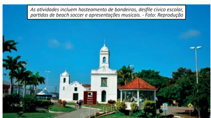
As atividades incluem hasteamento de bandeiras, desfile cívico escolar, partidas de beach soccer e apresentações musicais.