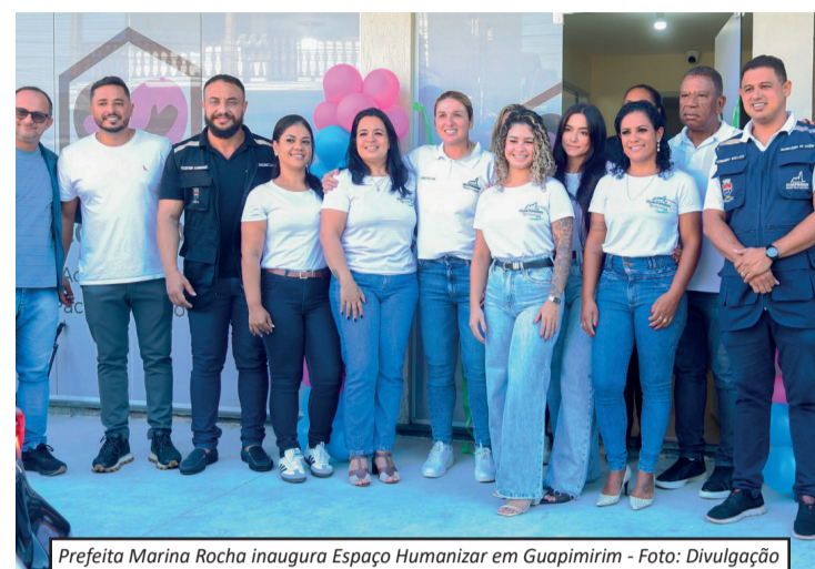
Prefeita Marina Rocha inaugura Espaço Humanizar em Guapimirim

o tratamento. Segundo a Secretaria Municipal de Saúde, o novo espaço funcionará de forma integrada à rede pública municipal, ajudando pacientes a terem acesso mais rápido e organizado aos serviços e especialidades médicas. Com a criação do Espaço Humanizar, Guapimirim reforça a proposta de ampliar políticas públicas voltadas ao cuidado, à saúde e à valorização da vida.