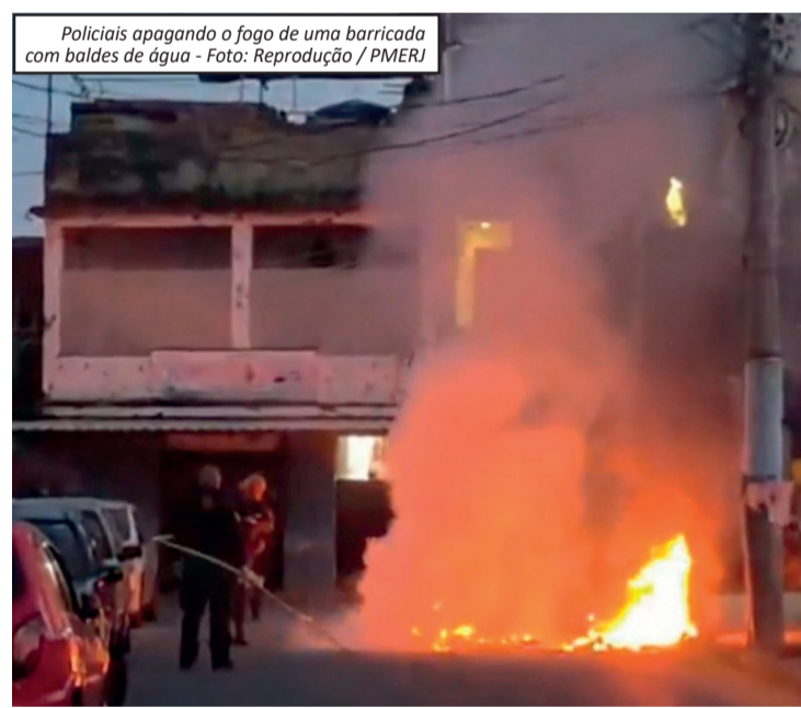
Policiais apagando o fogo de uma barricada com baldes de água

apoio do 1º Comando de Policiamento de Área e do Núcleo de Apoio às Operações Especiais. Equipes seguem atuando em diferentes pontos da comunidade. Por conta da movimentação policial, uma Unidade de Pronto Atendimento (UPA) da região suspendeu temporariamente as visitas, embora o atendimento aos pacientes continue funcionando normalmente, segundo a Secretaria Municipal de Saúde. Até o momento, não há informações sobre presos ou apreensões. A ocorrência segue em andamento.