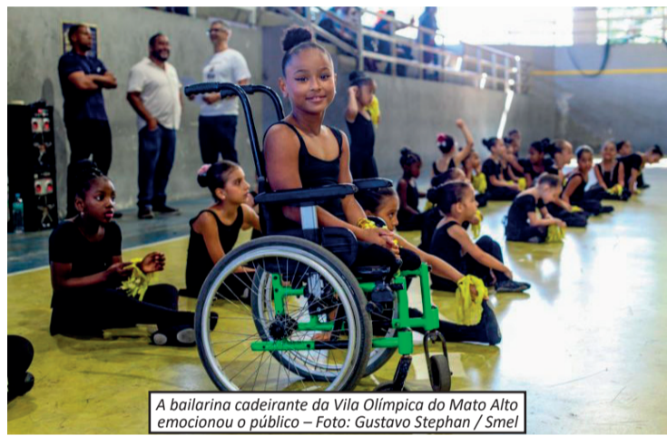
A bailarina cadeirante da Vila Olímpica do Mato Alto emocionou o público

A Vila Olímpica Professor Manoel José Gomes Tubino, na Praça Seca, Zona Oeste do Rio, recebeu mais de 300 atletas no primeiro Festival PCD Esportes Sem Limites, promovido pela Secretaria Municipal de Esportes. O evento celebrou a inclusão e incentivou a prática esportiva entre pessoas com deficiência atendidas pelas Vilas Olímpicas da cidade. Os participantes competiram em modalidades como