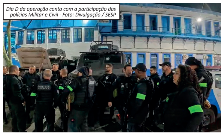
Dia D da operação conta com a participação das polícias Militar e Civil

As autoridades seguem nas ruas para localizar outros investigados ligados ao esquema criminoso.