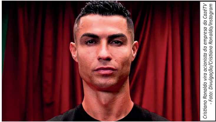
Cristiano Ronaldo vira acionista da empresa da CazéTV.

Cristiano Ronaldo agora faz parte do grupo de investidores da empresa responsável pela CazéTV. O craque português adquiriu participação na LiveModeTV, braço internacional da companhia brasileira que se destacou pelas transmissões esportivas digitais nos últimos anos. A entrada do jogador foi anunciada nesta quinta-feira (14) e faz parte do plano de expansão internacional da marca, especialmente pensando na Copa do Mundo de 2026. Com o acordo, Cristiano passa a integrar o quadro de acionistas da empresa, que pretende levar o modelo de transmissões gratuitas pela internet para outros países. O primeiro passo da expansão será em Portugal, onde a ideia