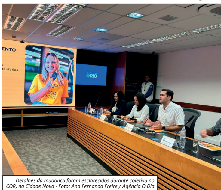
Detalhes da mudança foram esclarecidos durante coletiva no COR, na Cidade Nova

QR Code do aplicativo. De acordo com a Secretaria Municipal de Transportes, o cartão verde representa apenas 3,27% dos usuários do sistema. Como ele não exige CPF no cadastro, seguirá disponível principalmente para turistas e passageiros ocasionais. A prefeitura também reforçou que a medida busca combater fraudes na bilhetagem e aproximar o funcionamento dos ônibus ao modelo já utilizado nos BRTs e VLTs, onde o pagamento em dinheiro não é aceito há anos. A primeira linha a operar sem dinheiro será a 634 (Bananal x Saens Peña), na Ilha do Governador, que passará a ser administrada pela Mobi-Rio a partir deste domingo (17). As demais linhas municipais adotam a mudança oficialmente no dia 30 de maio.