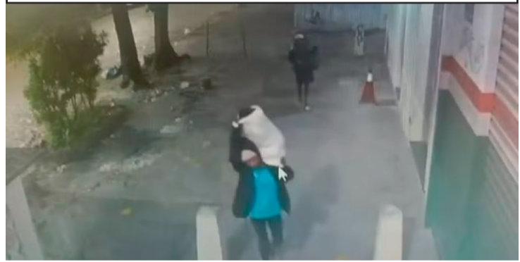
Câmeras de segurança registraram os criminosos deixando a escola - Foto: Reprodução/TV Globo

é de retomada das aulas até a próxima semana. O caso foi registrado na 21ª DP (Bonsucesso), que investiga a invasão e tenta identificar os responsáveis pelo crime.