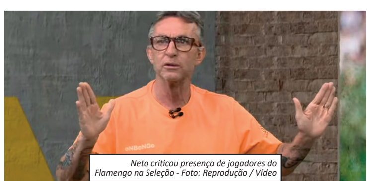
Neto criticou presença de jogadores do Flamengo na Seleção.

Segundo Neto, o Rubro-Negro aparece como o clube com mais jogadores na relação enviada à Fifa, com sete atletas cotados para disputar o Mundial. O comentarista questionou a quantidade de flamenguistas envolvidos na convocação e insinuou favorecimento nas escolhas.