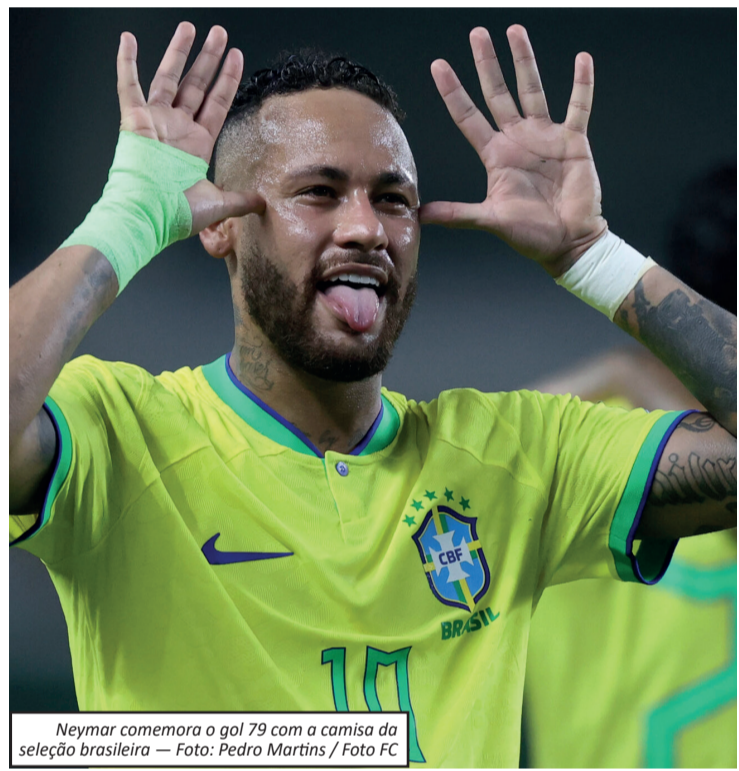
Neymar comemora o gol 79 com a camisa da seleção brasileira.

Após a classificação do Santos na Copa do Brasil, o técnico Cuca demonstrou confiança na presença de Neymar na próxima Copa do Mundo e afirmou que o atacante vive um momento importante de retomada no futebol brasileiro. O camisa 10 participou da vitória por 2 a 0 sobre o Coritiba, no Couto Pereira, contribuindo com assistência e sendo novamente decisivo para o Peixe. Depois da partida, o treinador afirmou acreditar que Neymar está cada vez mais próximo de garantir espaço na lista de Carlo Ancelotti para o Mundial. Segundo Cuca, o atacante já mostrou que pode contribuir de diferentes formas dentro de campo, mesmo