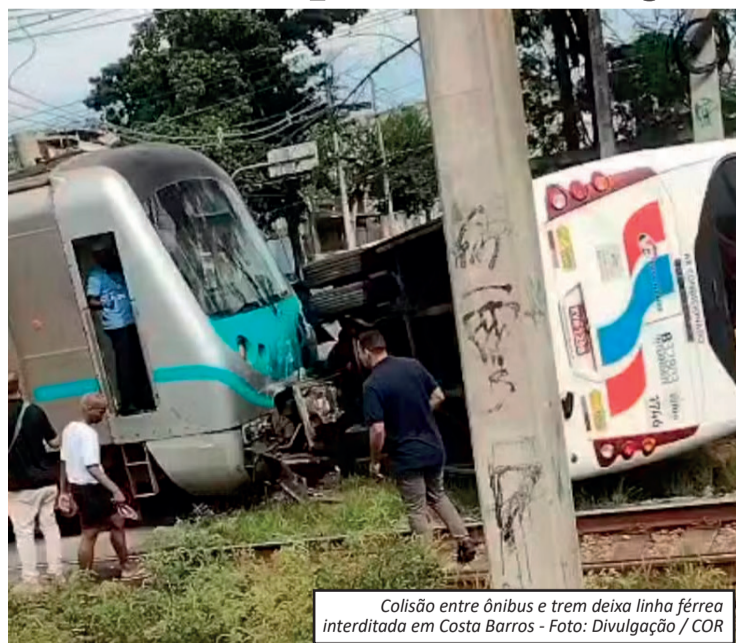
Colisão entre ônibus e trem deixa linha férrea interditada em Costa Barros

Um acidente entre um ônibus e um trem interditou parte da linha férrea em Costa Barros, na Zona Norte do Rio, na manhã desta quarta-feira (14). A colisão aconteceu próximo à passagem de nível da Rua Mogiqui, na Estrada do Camboatá, e afetou a circulação do ramal Belford Roxo. Segundo a SuperVia, o coletivo teria avançado a sinalização da passagem de nível e acabou sendo atingido pelo trem por volta das 11h20. Apesar do impacto, a concessionária informou que não houve passageiros feridos dentro da composição.