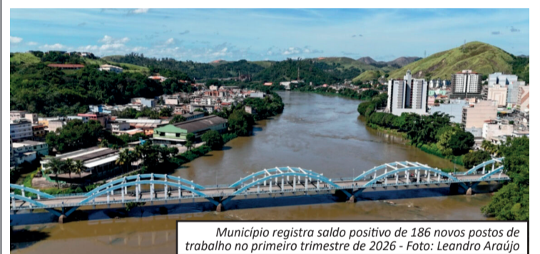
Município registra saldo positivo de 186 novos postos de trabalho no primeiro trimestre de 2026 - Foto: Leandro Araújo

Barra Mansa terminou o primeiro trimestre de 2026 na liderança da geração de empregos formais no Sul Fluminense. De acordo com dados do Novo Caged, divulgados pelo Ministério do Trabalho, o município registrou saldo positivo de 186 novas vagas com carteira assinada entre janeiro e março. O resultado coloca a cidade à frente de outros municípios da região e reforça o momento de crescimento econômico local. Segundo a prefeitura, o desempenho é fruto de ações voltadas ao planejamento e ao incentivo à atividade produtiva, com foco na atração de investimentos e na ampliação das oportunidades de trabalho. Entre as iniciativas, destaca-se o Balcão de Empregos, plataforma criada em 2025 para facilitar a conexão entre empresas e