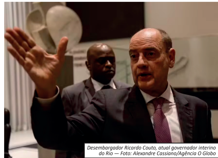
Desembargador Ricardo Couto, atual governador interino do Rio

De acordo com Ronaldo Damião, a iniciativa busca ampliar os mecanismos de controle interno, garantir maior transparência nos processos administrativos e valorizar o desempenho funcional como ferramenta de governança. Entre os critérios que deverão ser considerados na avaliação estão a produtividade, a qualidade técnica do trabalho, o cumprimento de prazos e a frequência dos servidores.