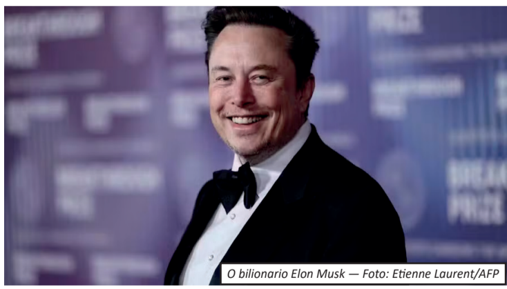
O bilionário Elon Musk

Foco em IA, robótica e operações espaciais O projeto surge como resposta à expectativa de que a demanda por poder computacional das empresas de Musk ultrapasse a capacidade dos atuais fornecedores globais de chips. A longo prazo, o plano é expandir significativamente essa produção. A meta inclui alcançar entre 100 e 200 gigawatts de capacidade computacional na Terra, além de atingir até um terawatt em operações no espaço. Com isso, o “Terafab” se posiciona como uma das iniciativas mais ousadas já propostas na área de tecnologia, integrando inteligência artificial, exploração espacial e infraestrutura digital em larga escala.