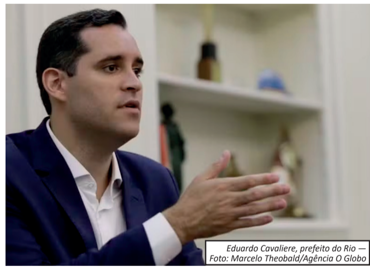
Eduardo Cavaliere, prefeito do Rio

Com a nova regra em vigor, a Prefeitura terá um prazo de 30 dias para se adequar ao limite estabelecido. Caso o percentual atual de cargos comissionados ocupados por não concursados esteja acima do permitido, será necessário apresentar um plano de ajuste. Esse plano deverá incluir diagnóstico da situação, medidas para redução gradual, cronograma de implementação e avaliação dos impactos administrativos, sempre considerando a continuidade dos serviços públicos e a eficiência da gestão.