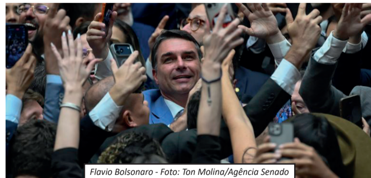
Flavio Bolsonaro

Pesquisa Futura/Apex indica Flávio Bolsonaro liderando intenções de voto no Rio, à frente de Lula em cenários de primeiro e segundo turnos. No primeiro, Flávio tem cerca de 43%, contra 34% de Lula. No segundo turno, marca 48% ante 39,9%. Na espontâ-