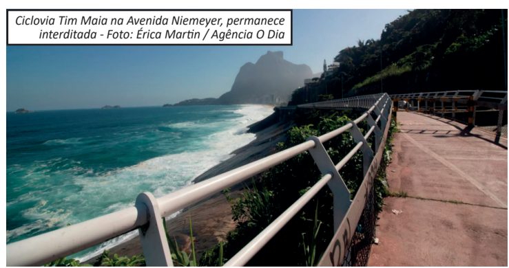
Ciclovía Tim Maia na Avenida Niemeyer, permanece interditada

fechado caso as ondas ultrapassem esse limite ou ventos atinjam 65 km/h. A previsão indica melhora no tempo a partir de quinta-feira (7), com dias ensolarados e temperaturas em elevação. Segundo o Alerta Rio, a máxima pode chegar a 32°C, com tendência de calor mais intenso até o fim de semana.