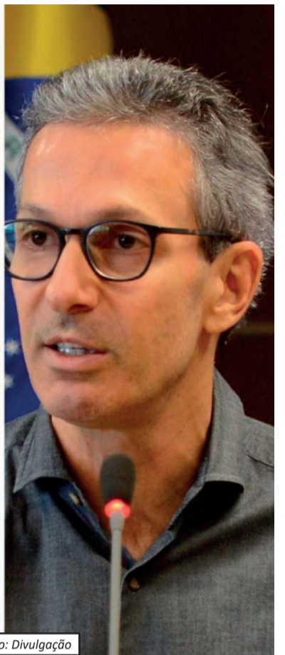
Em simulação de 1º turno sem Ciro, Lula tem 40% e Flávio 34%, seguidos por Caiado (5%) e Zema (4%).

margem de erro de dois pontos percentuais e nível de confiança de 95%. Além da disputa eleitoral, o levantamento mediu a opi-