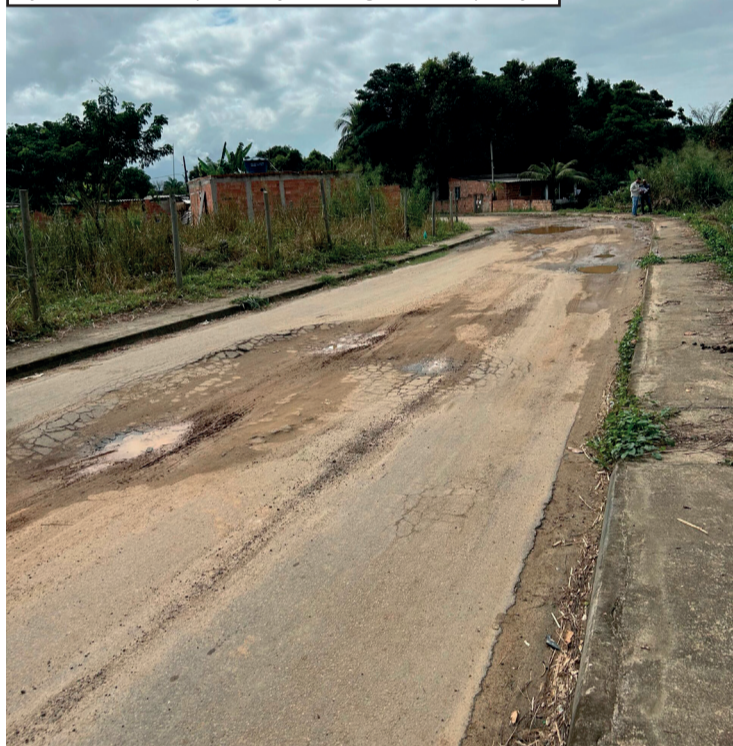
Rua Jandáia será a primeira a receber reparos após vistoria identificar falhas estruturais em pavimentação e drenagem

Na segunda-feira (04), a Prefeitura de Japeri solicitou e acompanhou uma vistoria técnica nas obras de drenagem e pavimentação do bairro Delamare, após identificar diversas falhas estruturais. As intervenções, realizadas pelo Governo do Estado do Rio de Janeiro por meio das empresas Omega e União Norte, foram concluídas em 2024. No entanto, pouco tempo depois, moradores e a própria Prefeitura passaram a notar problemas em vários trechos das vias. Após a vistoria, a Prefeitura notificou o Estado, responsável pela obra, e solicitou a correção imediata dos serviços. A inspeção contou com fiscais estaduais, representantes das empresas