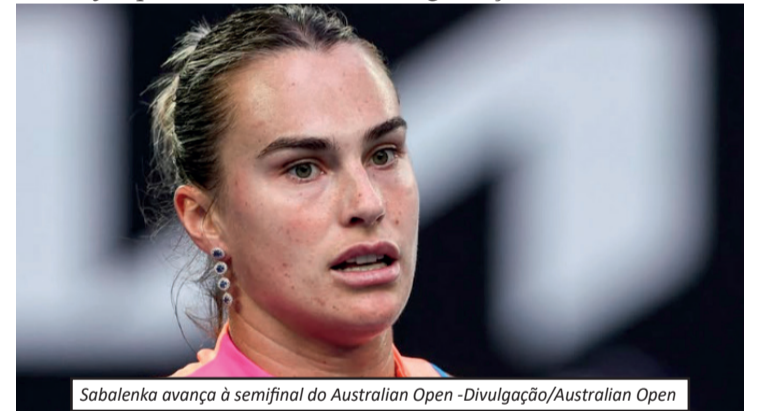
Sabalenka avança à semifinal do Australian Open

é um dos eventos mais prestigiados do esporte. Até o momento, os organizadores do torneio não se manifestaram oficialmente sobre as possíveis medidas ou negociações em andamento.