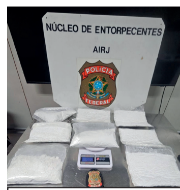
Agentes encontraram a droga escondida sob as vestes da passageira.

A suspeita responderá por tráfico internacional de drogas.