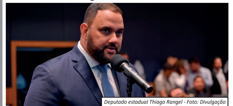
Deputado estadual Thiago Rangel

O deputado estadual Thiago Rangel (Avante), de 39 anos, foi preso nesta terça-feira (5) durante a quarta fase da Operação Unha e Carne, da Polícia Federal. A investigação apura fraudes em contratos públicos da Secretaria de Estado de Educação do Rio (Seeduc), envolvendo compras de materiais, serviços e obras em escolas estaduais. Ao todo, foram expedidos sete mandados de prisão e 23 de busca e apreensão em cidades como Rio de Janeiro, Campos dos Goytacazes, Miracema e Bom Jesus do Itabapoana. As ordens partiram do Supremo Tribunal Federal. Segundo a PF, o esquema