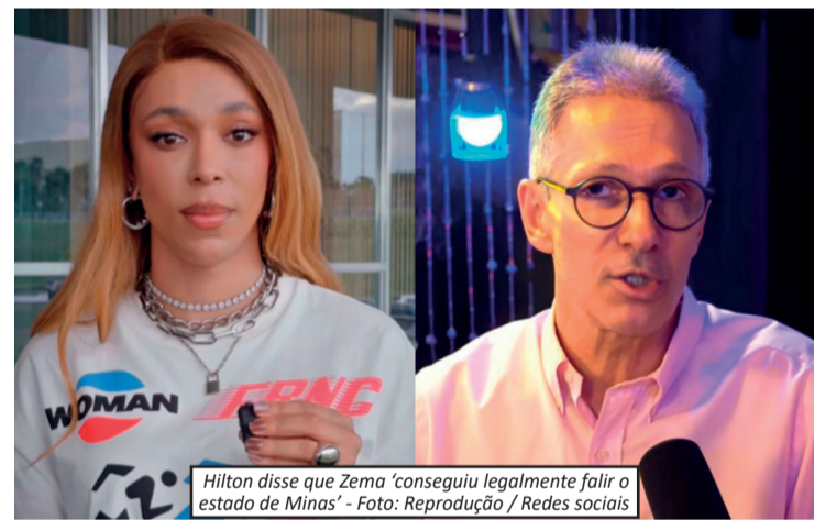
Hilton disse que Zema 'conseguiu legalmente falar o estado de Minas'

pai e que isso teria contribuído para sua formação pessoal e profissional. A resposta de Hilton veio em tom duro. A deputada criticou a gestão de Zema à frente do governo de Minas Gerais, acusando-o de promover políticas que, segundo ela, prejudicaram o estado. Além disso, questionou a trajetória do político e fez referência ao desempenho dele em pesquisas eleitorais. A troca de acusações ganhou repercussão nas redes sociais e ampliou o debate sobre trabalho infantil, educação e condições de trabalho no Brasil — temas que vêm sendo discutidos também no cenário político nacional.