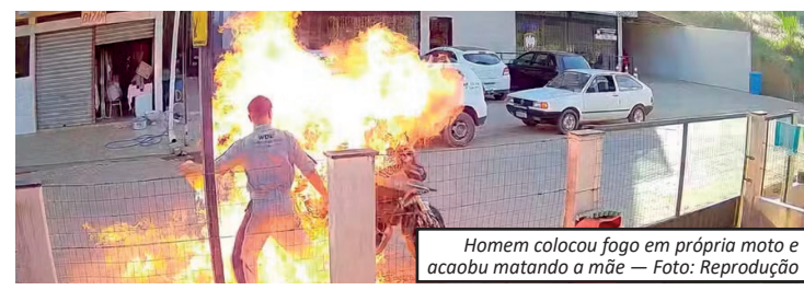
Homem colocou fogo em própria moto e acabou matando a mãe

mem ateou fogo no veículo após discussão com agentes. A vítima foi atingida pelas chamas e ficou internada por cinco dias. O filho foi preso e responde por tentativa de homicídio, incêndio e resistência à ação policial.