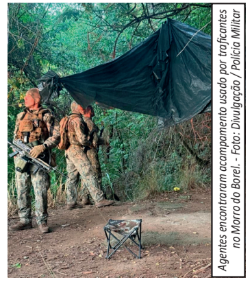
Agentes encontraram acampamento usado por traficantes no Morro do Borel

A ação foi motivada por confrontos entre o Comando Vermelho (CV) e o Terceiro Comando Puro (TCP), que disputam áreas na região. Durante a incursão, policiais localizaram um acampamento em área de mata usada como base por traficantes, com indícios de armazenamento de armas e drogas. A operação ocorre após dias de intensos tiroteios, que geraram medo entre moradores e foram ouvidos em bairros próximos.