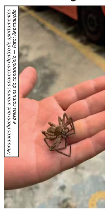
Moradores dizem que aranhas aparecem dentro de apartamentos e áreas comuns do condomínio

conter o avanço dos animais. O condomínio realiza dedetizações periódicas, a cada três meses, como forma de controle, mas os moradores afirmam que a estratégia não tem sido suficiente para resolver o problema. Especialistas em controle de pragas alertam que áreas com vegetação densa e falta de manutenção favorecem a presença desses animais, aumentando o risco de infestação em imóveis próximos. Procurada, a Prefeitura do Rio ainda não se posicionou sobre possíveis ações para solucionar o caso. O responsável pelo terreno também não respondeu aos questionamentos.