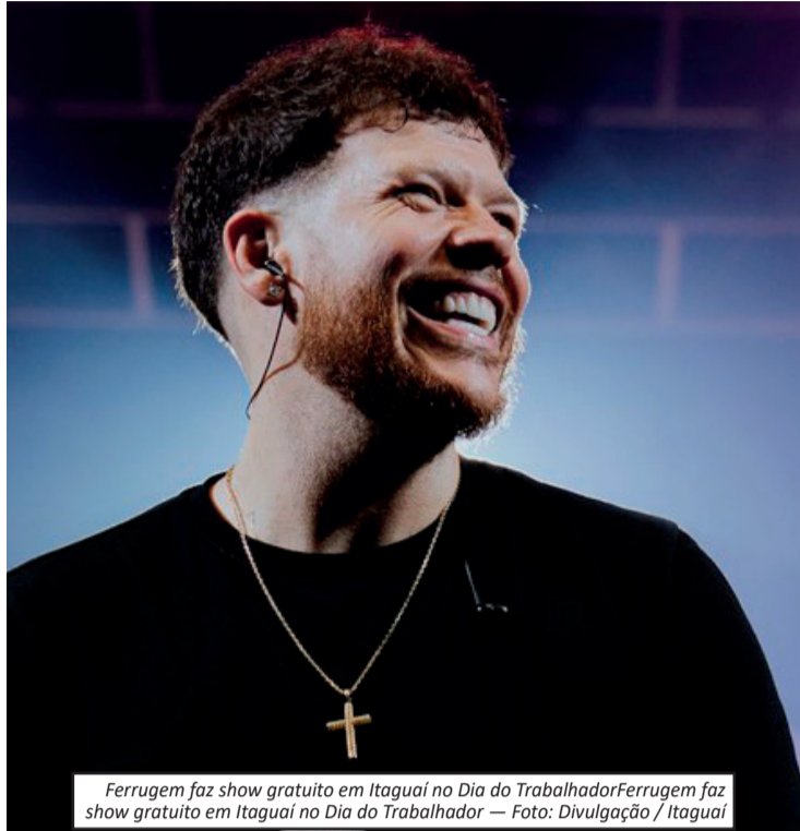
Ferrugem faz show gratuito em Itaguaí no Dia do Trabalhador. Ferrugem faz show gratuito em Itaguaí no Dia do Trabalhador

O município de Itaguaí prepara uma programação especial para celebrar o Dia do Trabalhador nesta sexta-feira (1º), com destaque para o show do cantor Ferrugem. A apresentação será realizada no Parque Municipal de Eventos e tem entrada gratuita.