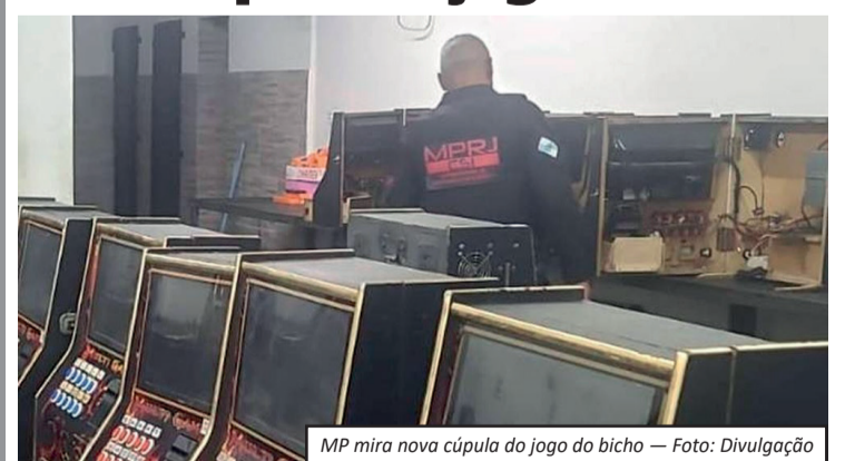
MP mira nova cúpula do jogo do bicho