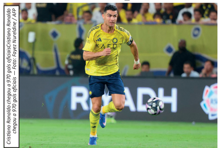
Cristiano Ronaldo chegou a 970 gols oficiais Cristiano Ronaldo chegou a 970 gols oficiais

almente, já soma cerca de 970 na carreira profissional, número que o coloca entre os maiores artilheiros da história do futebol. Mesmo com a proximidade da aposentadoria, o atacante deixou claro que ainda mantém o prazer de jogar e o compromisso com o desempenho dentro de campo. Segundo ele, a motivação vai além da geração atual, envolvendo também o legado construído ao longo de mais de duas décadas no futebol. A fala reforça um cenário já esperado nos bastidores do esporte: Ronaldo entra na reta final de uma carreira marcada por recordes, títu-