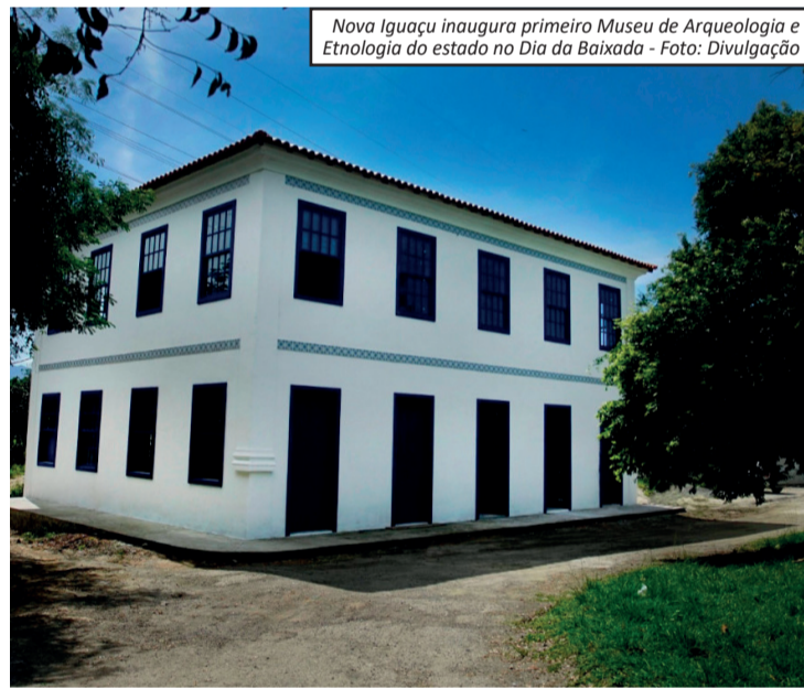
Nova Iguaçu inaugura primeiro Museu de Arqueologia e Etnologia do estado no Dia da Baixada - Foto: Divulgação

Com a inauguração, Nova Iguaçu dá um passo significativo na preservação de seu passado e na construção de novas formas de acesso à cultura, transformando um patrimônio histórico em um espaço vivo de aprendizado e reflexão para a população.