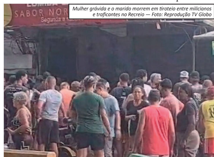
Mulher grávida e o marido morrem em tiroteio entre milicianos e traficantes no Recreio