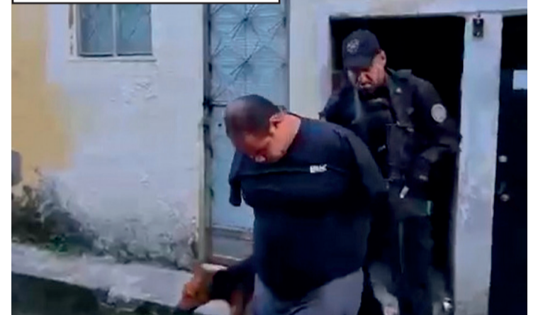
Ele acabou detido dentro de casa, no Complexo do Chapadão

tificar outros envolvidos no esquema e aprofundar o mapeamento da atuação do grupo na região