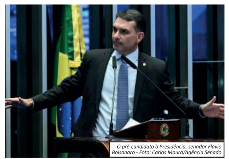
O pré-candidato à Presidência, senador Flávio Bolsonaro

A escolha de ministros do STF é uma das atribuições do presidente da República e depende da aprovação da maioria absoluta do Senado. Diante do cenário atual, o tema segue em destaque no debate político nacional.