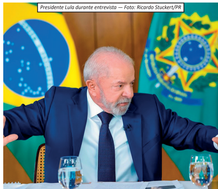
Presidente Lula durante entrevista

O presidente Luiz Inácio Lula da Silva sinalizou a aliados que pretende indicar um novo nome ao Supremo Tribunal Federal nas próximas semanas, após a rejeição do advogado-geral da União, Jorge Messias, pelo Senado Federal do Brasil.