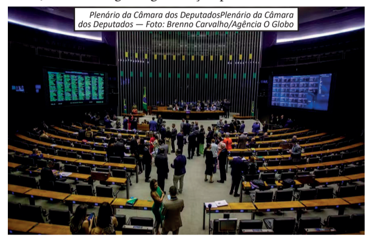
Plenário da Câmara dos Deputados

para o Senado, onde ainda poderá sofrer alterações antes de uma eventual sanção presidencial.