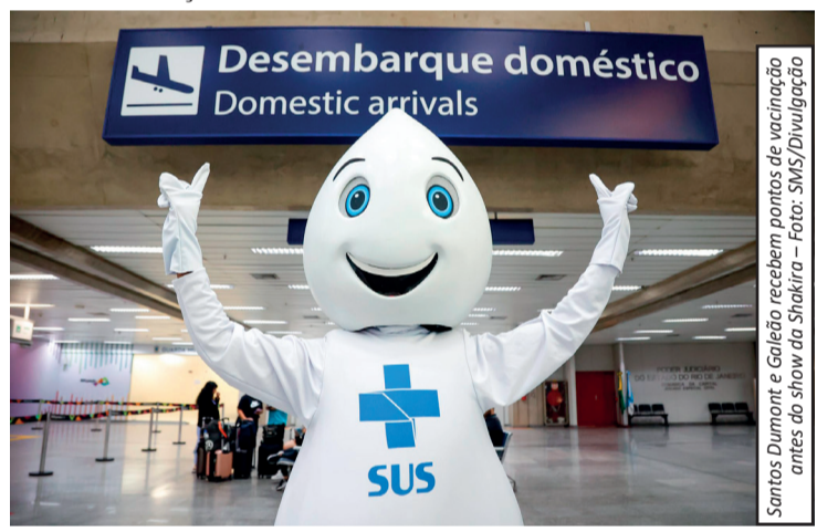
Santos Dumont e Galeão recebem pontos de vacinação antes do show da Shakira

nacional, já que diversos países das Américas registraram aumento de casos da doença, o que eleva o risco de reintrodução do vírus no Brasil. Além dos aeroportos, a vacina segue disponível em unidades de saúde da cidade, como clínicas da família e centros municipais, reforçando a rede de proteção. A orientação das autoridades é que a população mantenha a caderneta de vacinação atualizada, já que o sarampo é uma doença altamente contagiosa e de rápida transmissão. A ação integra um conjunto de medidas preventivas adotadas pelo município para evitar surtos e manter o controle epidemiológico, especialmente em períodos de maior circulação de pessoas, como férias e eventos internacionais.