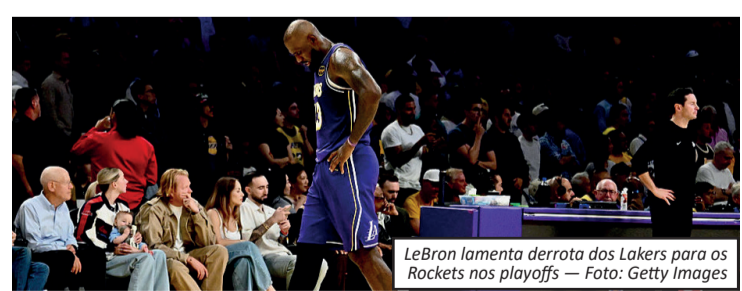
LeBron lamenta derrota dos Lakers para os Rockets nos playoffs

pelo tom de desabafo. “Estou pouco me fodendo pra isso. Sério. Isso não decide jogo nenhum. Vai pra dentro de quadra e resolve. Pergunta pros mais novos... eu sou velho demais pra essa porra”, disparou o jogador, visivelmente irritado com a narrativa criada em torno do confronto. A fala rapidamente viralizou nas redes sociais e ganhou grande repercussão na imprensa esportiva internacional, principalmente pelo contraste entre a postura mais experiente de LeBron e o tom provocativo vindo do jovem adversário. Dentro de quadra, o astro dos Lakers teve mais uma atuação consistente, soman-