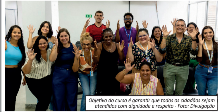
Objetivo do curso é garantir que todos os cidadãos sejam atendidos com dignidade e respeito

A Prefeitura de Belford Roxo iniciou um curso de Língua Brasileira de Sinais (Libras) voltado aos servidores da Secretaria Municipal de Assistência Social e Cidadania. A iniciativa tem como objetivo promover a inclusão e aprimorar o atendimento à população surda ou com deficiência auditiva. As aulas começaram nesta semana e ocorrem na sede da secretaria, com turmas nos períodos da manhã e da tarde. A formação é contínua, com encontros