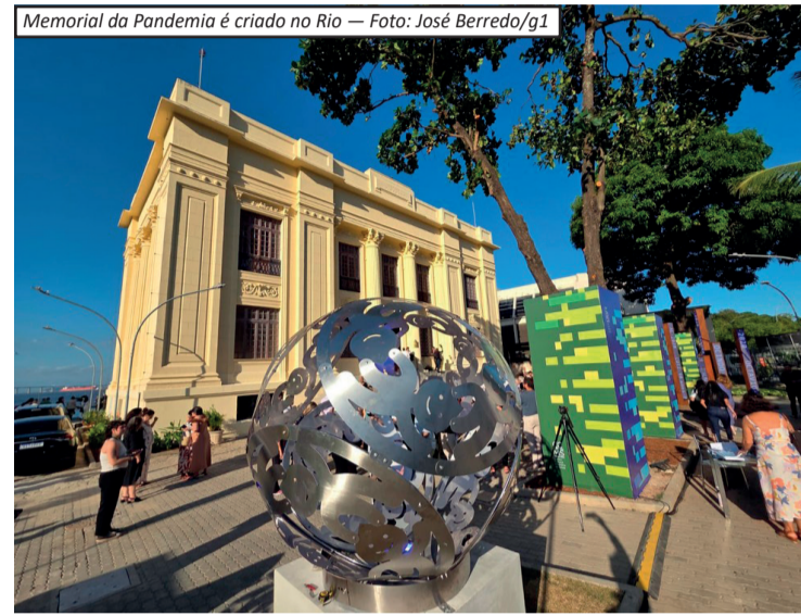
Memorial da Pandemia é criado no Rio

mação durante o período, afirmando que o descrédito da ciência e a banalização do sofrimento não devem ser esquecidos. Segundo ele, o memorial surge como um espaço de memória e aprendizado coletivo. Além da inauguração, as atividades do dia incluíram uma agenda na Fundação Oswaldo Cruz (Fiocruz), voltada à regulamentação da profissão de sanitário. Na ocasião, foram entregues os primeiros registros profissionais da categoria, que atua em áreas como vigilância sanitária, epidemiológica e ambiental. O Memorial da Pandemia passa a integrar os espaços de memória da cidade, com uma programação voltada à conscientização e ao reconhecimento dos impactos sociais e humanos causados pela crise sanitária.