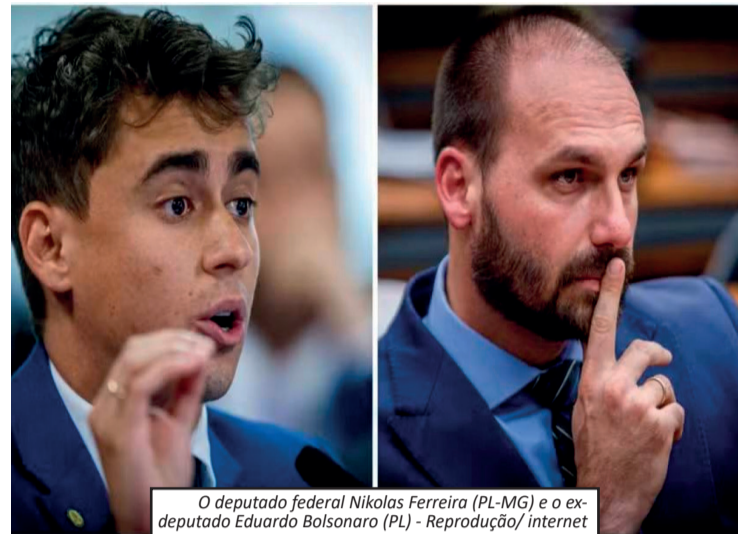
O deputado federal Nikolas Ferreira (PL-MG) e o ex-deputado Eduardo Bolsonaro (PL)

O ex-deputado Eduardo Bolsonaro voltou a expor publicamente desentendimentos com o deputado federal Nikolas Ferreira, afirmando que não pode "aceitar ser humilhado" pelo colega de partido. A declaração foi feita em resposta a discussões nas redes sociais envolvendo aliados da direita. Em um longo texto, Eduardo disse que pretende encerrar o assunto, mas aproveitou para relembrar sua atuação na trajetória política de Niko-