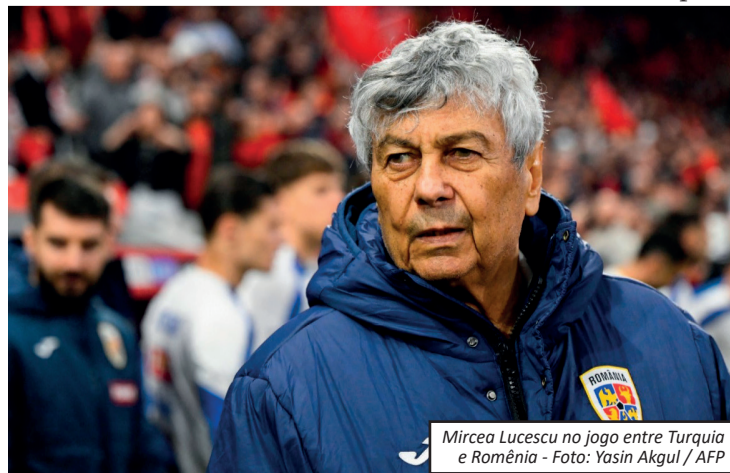
Mircea Lucescu no jogo entre Turquia e Romênia

Reconhecido como um dos maiores nomes do futebol romeno, Mircea Lucescu deixa um legado significativo dentro e fora de campo.