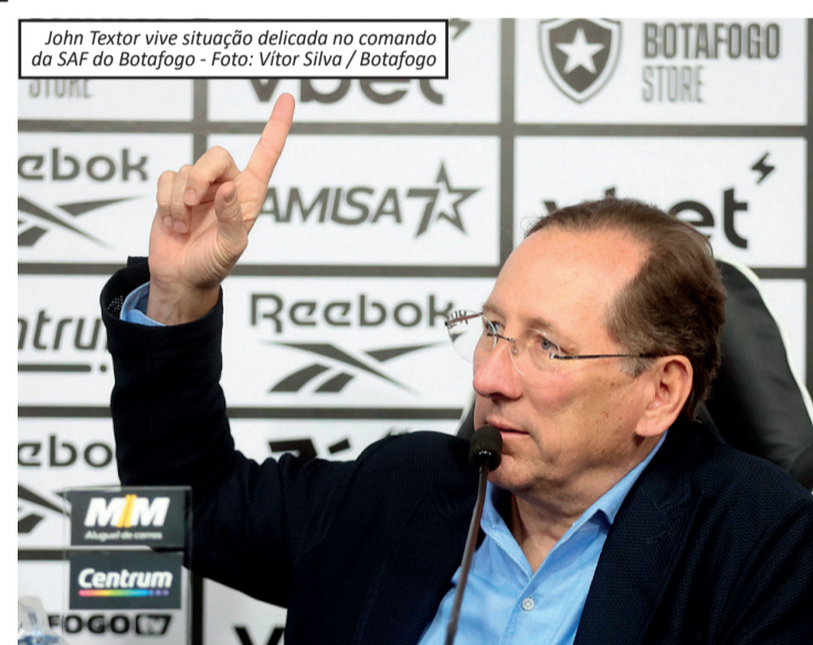
John Textor vive situação delicada no comando da SAF do Botafogo

O impasse evidencia o momento de instabilidade na gestão do futebol do Botafogo, envolvendo disputas societárias, necessidade de caixa e decisões estratégicas sobre o futuro da SAF.