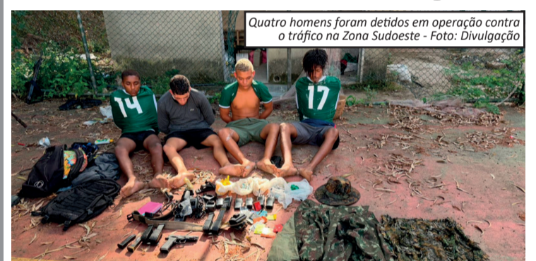
Quatro homens foram detidos em operação contra o tráfico na Zona Sudoeste

Agentes da Polícia Civil do Estado do Rio de Janeiro prenderam quatro homens e desarticularam um ponto de venda de drogas durante uma operação realizada na Estrada dos Bandeirantes, em Jacarepaguá, na Zona Oeste da cidade. A ação foi conduzida por equipes da Delegacia de Roubos e Furtos de Cargas, após investigações apontarem que o imóvel era utilizado para a comercialização de entorpecentes. Durante a operação, os policiais encontraram drogas já preparadas para venda, além de uma arma de fogo, munições, uma granada, rádios comunicadores e anotações relacionadas