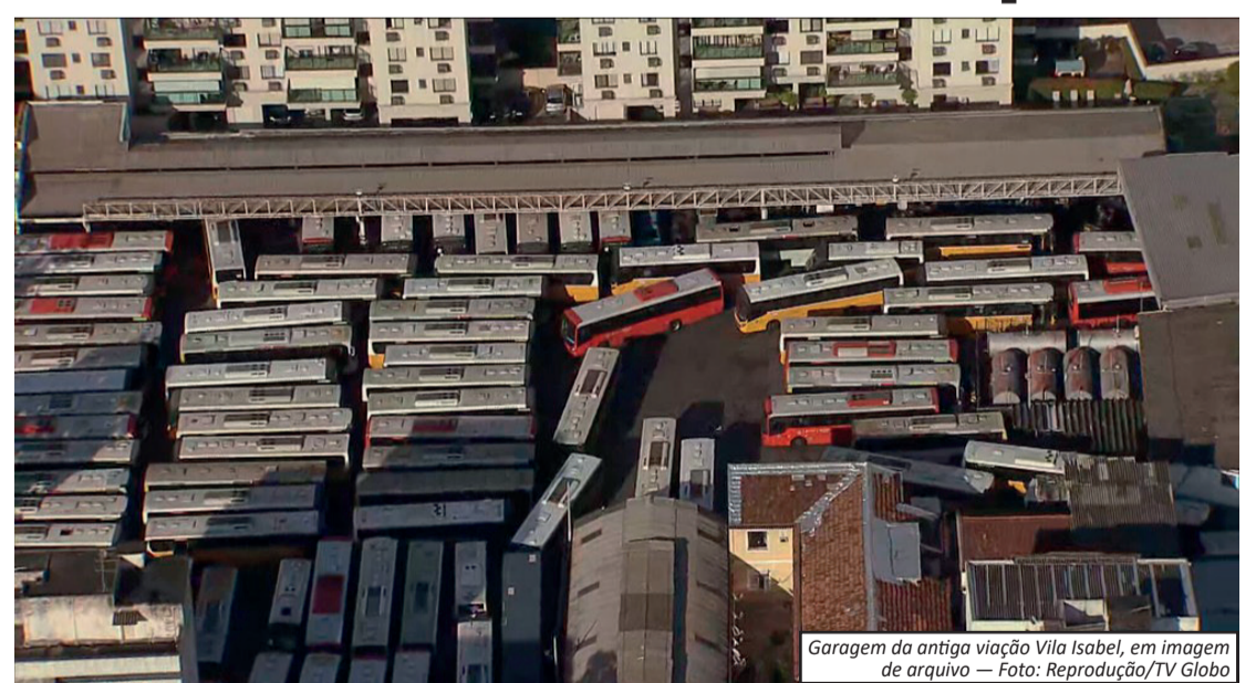
Garagem da antiga viação Vila Isabel, em imagem de arquivo

A Prefeitura do Rio de Janeiro iniciou o processo de desapropriação de 19 imóveis ligados a empresas de ônibus na cidade, com o objetivo de viabilizar a construção de novas garagens e reforçar a infraestrutura do transporte coletivo. A medida foi oficializada por meio de decreto publicado no Diário Oficial nesta terça-feira (7). Entre os locais incluídos estão garagens de empresas que ainda operam linhas importantes do sistema municipal, como a Braso Lisboa e a Transportes Campo Grande, além de outras viações como Pavunense, Viação Novacap e Auto Viação Jabour. O decreto também abrange imóveis de empresas que já não atuam mais na cidade, como as antigas garagens das viações Real e Viação Vila Isabel, esta última interdita pela própria prefeitura no início do ano. As desapropriações atingem tanto unidades desativadas quanto espaços ainda em funcionamento, distribuídos por bairros das zonas Norte, Oeste