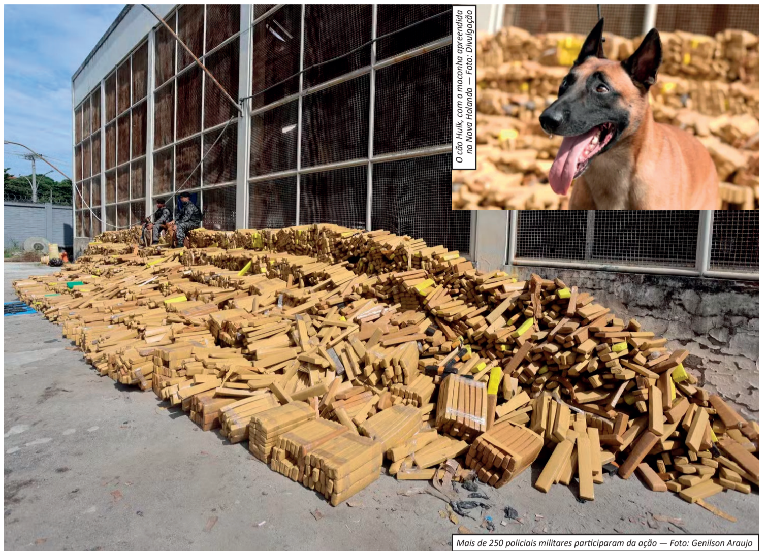
O cão Hulck, com a maconha apreendida na Nova Holanda

Comando Vermelho. Durante a operação, equipes foram alvo de ataques a tiros, o que resultou em confrontos armados enquanto a carga era retirada do local. Mesmo assim, os policiais conseguiram concluir a ação e garantir a apreensão. Além da grande quantidade de drogas, os agentes também apreenderam cinco fuzis e quatro pistolas, além de recuperar 26 veículos roubados, incluindo carros e motocicletas. Um suspeito foi baleado durante a ação, socorrido e encaminhado ao hospital, onde permanece sob custódia. A operação contou com a participação de mais de 250 agentes, envolvendo unidades como o BOPE, BPChq, BTM, o 22º BPM (Maré) e o Grupamento Aeromóvel. Segundo a corporação, a ação foi resultado de planejamento estratégico e trabalho de inteligência, sendo considerada um golpe significativo contra o tráfico de drogas na região. A operação também revelou a existência de uma estrutura organizada de armazenamento e distribuição de entorpecentes dentro da comunidade.