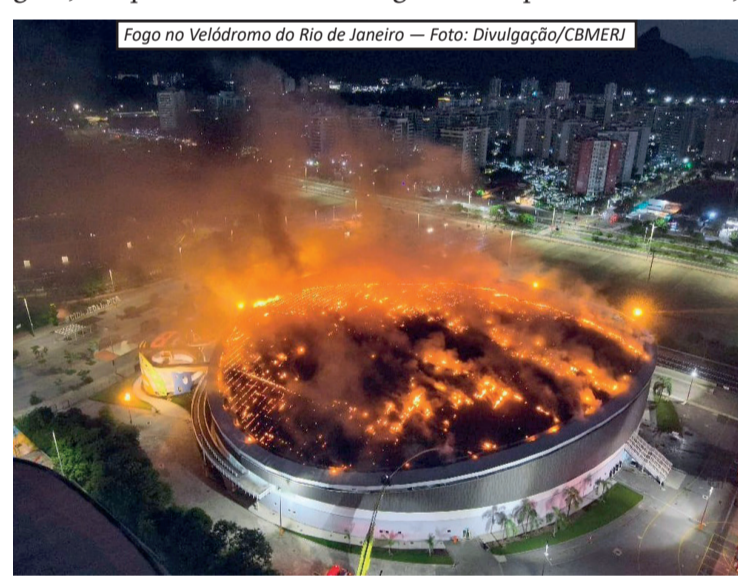
Fogo no Velódromo do Rio de Janeiro

sedando as competições de ciclismo de pista. Desde então, o espaço passou a ser utilizado para treinamentos e atividades esportivas, atendendo cerca de 4 mil pessoas em diversas modalidades, como vôlei, basquete, ginástica, ciclismo, judô e jiu-jitsu. O local também recebe eventos e abriga parcerias com confederações esportivas, sendo um importante centro de formação e preparação de atletas. Em 2025, o espaço recebeu aproximadamente 50 eventos e ganhou ainda mais relevância com a inauguração do museu olímpico, que reúne objetos históricos, como medalhas, tochas e equipamentos utilizados nos Jogos. Vale lembrar que o Velódromo já havia registrado episódios de incêndio em 2017, quando o telhado foi atingido em duas ocasiões após quedas de balões, mas com danos menores em comparação ao ocorrido agora.