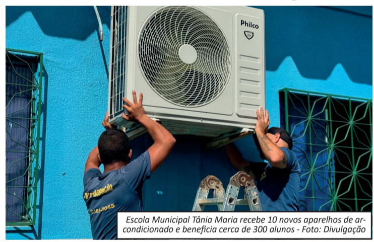
Escola Municipal Tânia Maria recebe 10 novos aparelhos de ar-condicionado e beneficia cerca de 300 alunos

Além da instalação dos aparelhos, a unidade também está recebendo reparos emergenciais para garantir que o retorno às aulas aconteça com mais segurança e conforto para alunos e profissionais. Com as melhorias, a Escola Municipal Tânia Maria inicia o novo ano letivo oferecendo mais qualidade, bem-estar e estrutura para seus estudantes.