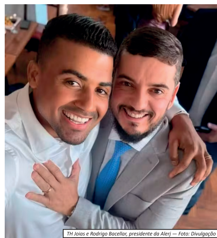
TH Joias e Rodrigo Bacellar, presidente da Alerj

gun revelou indícios de um esquema que envolveria integrantes do Comando Vermelho, agentes públicos e políticos. A suspeita é de que o grupo buscava acesso privilegiado a informações internas e proteção institucional, além de atuar na negociação de armas e equipamentos. As apurações também indicam possíveis crimes de organização criminosa, tráfico internacional de armas e drogas, corrupção e lavagem de dinheiro. Houve ainda bloqueio de bens que podem chegar a R$ 40 milhões. Com a conclusão do indiciamento, o material será encaminhado ao Ministério Público, responsável por analisar se apresentará denúncia formal à Justiça.