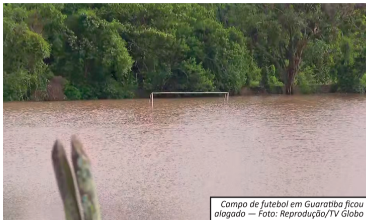
Campo de futebol em Guaratiba ficou alagado

O temporal também atingiu a vizinha Paraty, a cerca de 90 quilômetros de Angra. Rios transbordam e