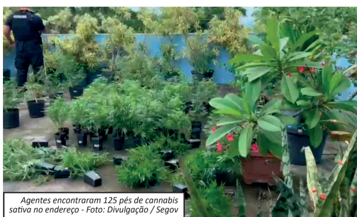
Agentes encontraram 125 pés de cannabis sativa no endereço

Entre os equipamentos apreendidos estavam 12 painéis de iluminação específicos para o cultivo indoor, avaliados em aproximadamente R$ 60 mil, além de insumos e utensílios utilizados na preparação da droga para distribuição. No terraço da residência, os agentes identificaram ainda um espaço adaptado que funcionaria como laboratório para plantio e manipulação da substância. Inicialmente, a proprietária do imóvel foi conduzida e recebeu voz de prisão.