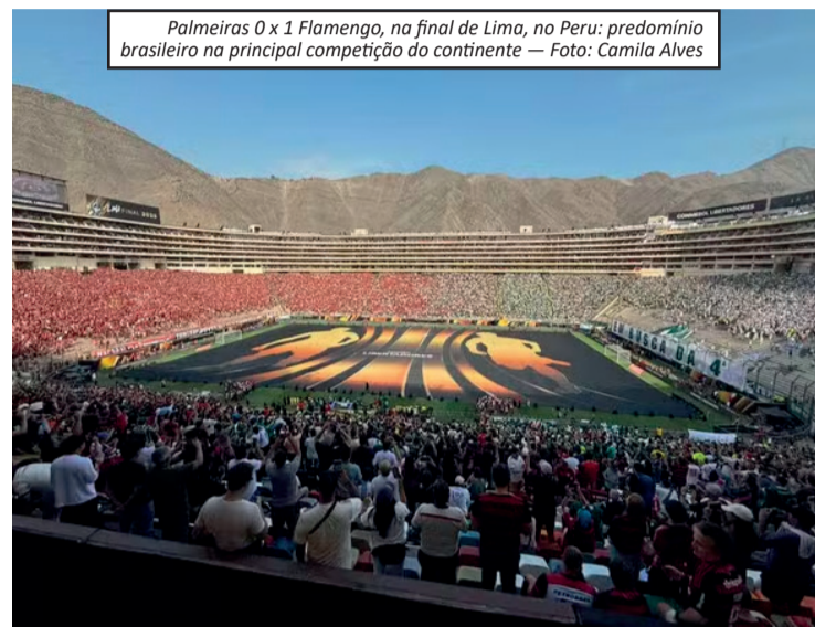
Palmeiras 0 x 1 Flamengo, na final de Lima, no Peru: predomínio brasileiro na principal competição do continente

O sorteio da fase de grupos da Libertadores e da Copa Sul-Americana está marcado para 19 de março, em Assunção, no Paraguai. A final da Libertadores deste ano será disputada em Montevidéu, no Uruguai, enquanto a decisão da Sul-Americana acontecerá em Barranquilla, na Colômbia. A dirigente reforçou que o desafio da Conmebol será equilibrar crescimento econômico e competitividade esportiva, evitando que a distância entre o futebol brasileiro e os demais países do continente se torne ainda maior.