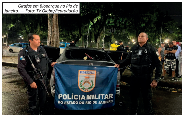
Girafas em Bioparque no Rio de Janeiro.

Ele chegou a ser internado em estado gravíssimo no Hospital Souza Aguiar, mas morreu em janeiro de 2025 em decorrência dos ferimentos.