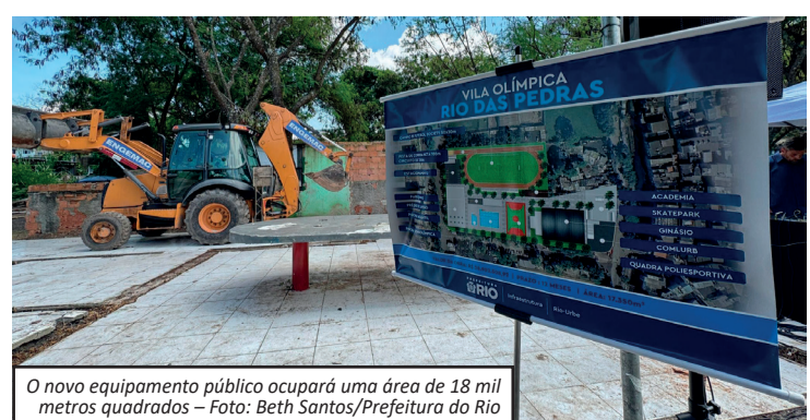
O novo equipamento público ocupará uma área de 18 mil metros quadrados - Foto: Beth Santos/Prefeitura do Rio

A Prefeitura do Rio iniciou a construção da Vila Olímpica de Rio das Pedras, com investimento de R$ 28,9 milhões. O espaço terá 18 mil metros quadrados e foco em esporte, inclusão e qualidade de vida. O prefeito Eduardo Paes destacou a importância do projeto para lazer e formação de