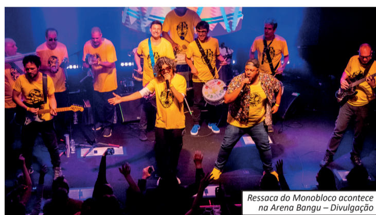
Ressaca do Monobloco acontece na Arena Bangu

Nos palcos, Susana Vieira estrela o monólogo "Lady",