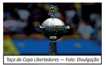
Taça da Copa Libertadores

grupo com dois brasileiros. A definição desta etapa é decisiva para a composição final dos participantes da fase de grupos e movimento a reta inicial da principal competição de clubes do continente.