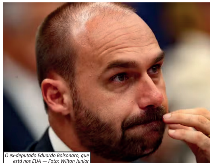
O ex-deputado Eduardo Bolsonaro, que está nos EUA

A Corregedoria Regional da Polícia Federal no Rio de Janeiro determinou o afastamento preventivo do ex-deputado federal Eduardo Bolsonaro (PL) do cargo de escrivão lotado na Delegacia da PF em Angra dos Reis, na Costa Verde fluminense. A medida é válida até a conclusão do Processo Administrativo Disciplinar (PAD) instaurado para apurar faltas consideradas injustificadas. O procedimento foi aberto em 27 de janeiro de 2026 e investiga a ausência do