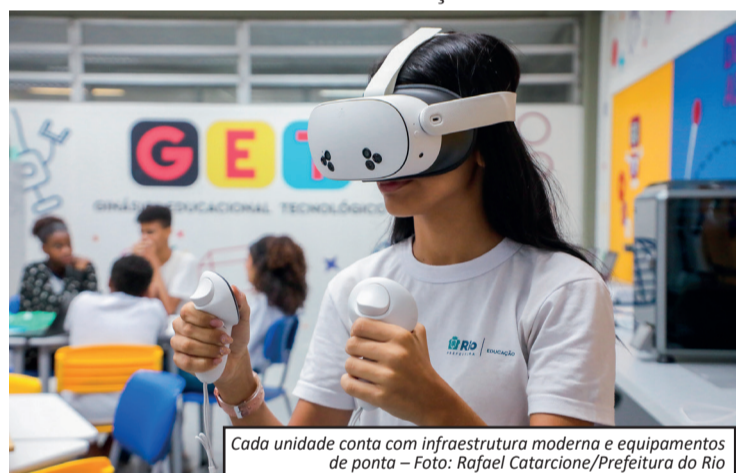
Cada unidade conta com infraestrutura moderna e equipamentos de ponta

Segundo a prefeitura, os GETs já atendem cerca de 125 mil estudantes, com meta de chegar a 350 unidades ainda este ano e alcançar 500 até 2028.