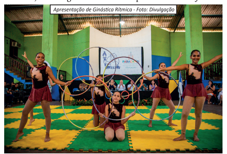
Apresentação de Ginástica Rítmica

A programação segue nos próximos dias, com atividades que devem movimentar a cidade e incentivar a prática esportiva entre os jovens.