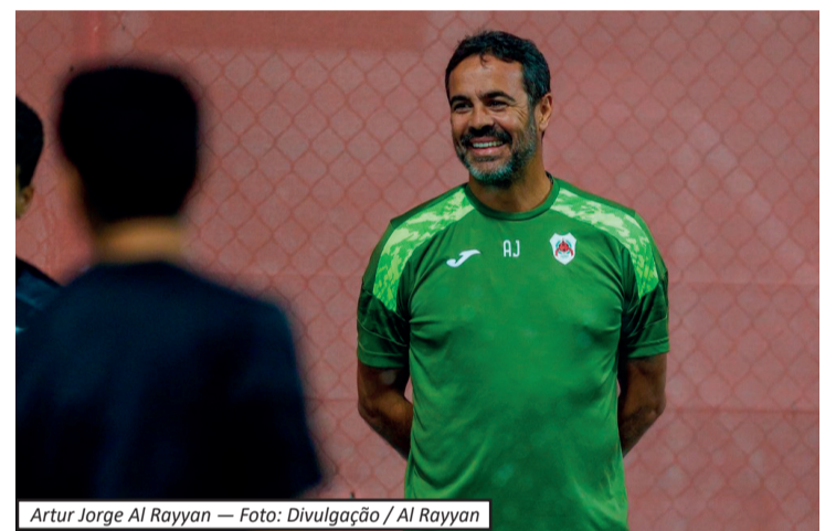
Artur Jorge Al Rayyan

O técnico português, de 54 anos, está no Catar desde