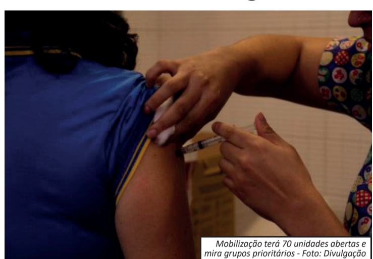
Mobilização terá 70 unidades abertas e mira grupos prioritários

A orientação é que pessoas com febre ou infecção ativa aguardem a recuperação antes de se vacinar. Já crianças menores de seis meses e pessoas com histórico de reação alérgica grave a doses anteriores não devem receber o imunizante. Após o Dia D, a vacinação