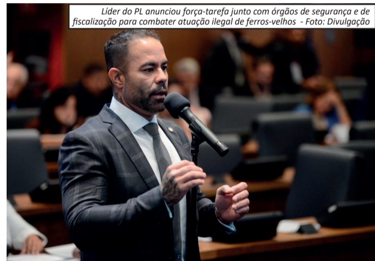
Líder do PL anunciou força-tarefa junto com órgãos de segurança e de fiscalização para combater atuação ilegal de ferros-velhos

Medida prevê fiscalização e fechamento de estabelecimentos irregulares