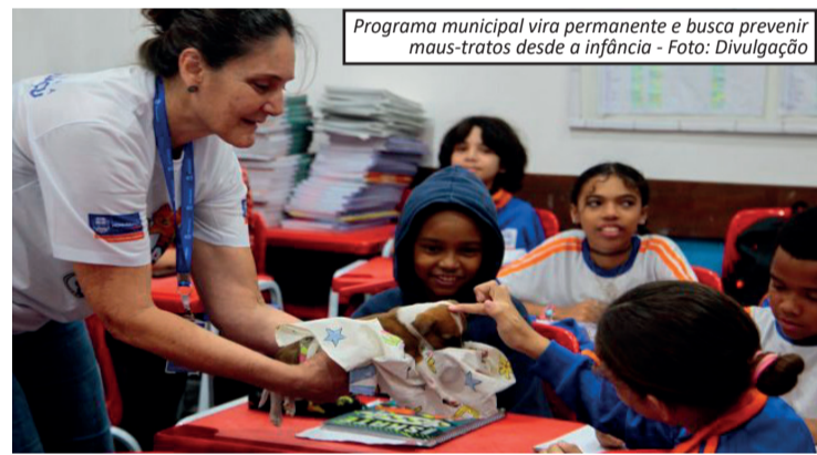
Programa municipal vira permanente e busca prevenir maus-tratos desde a infância

A proposta é simples: incentivar, desde a infância, o respeito aos animais como parte da formação social, reduzindo casos de violência no futuro.