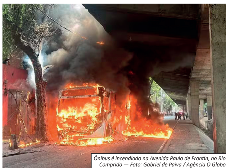
Ônibus é incendiado na Avenida Paulo de Frontin, no Rio Comprido

Impactos na cidade A situação provocou reflexos imediatos: comércio fechado no entorno, trânsito com desvios e retenções; interdições em vias do Catumbi e Rio Comprido; ônibus atravessados e linhas com itinerários alterados. O Centro de Operações Rio orienta motoristas a evitarem a região. O tráfego