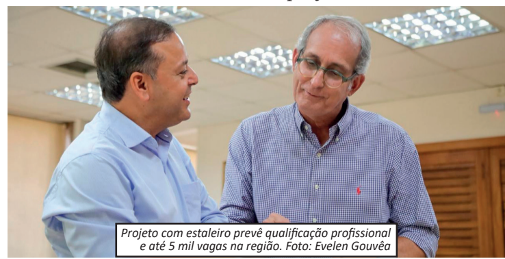
Projeto com estaleiro prevê qualificação profissional e até 5 mil vagas na região.

De acordo com representantes do estaleiro, a parceria com o município busca ampliar a formação profissional e criar oportunidades de trabalho com maior qualificação na cidade.