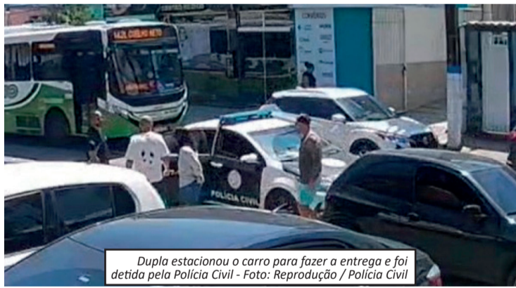
Dupla estacionou o carro para fazer a entrega e foi detida pela Polícia Civil

rida, onde apreenderam diversos produtos irregulares. A venda desse tipo de substância é proibida sem prescrição médica e controle sanitário, conforme normas da Agência Nacional de Vigilância Sanitária. Levados para a delegacia, os suspeitos optaram por não prestar depoimento formal, mas confirmaram que os produtos eram anabolizantes. Eles permanecem à disposição da Justiça e devem passar por audiência de custódia.