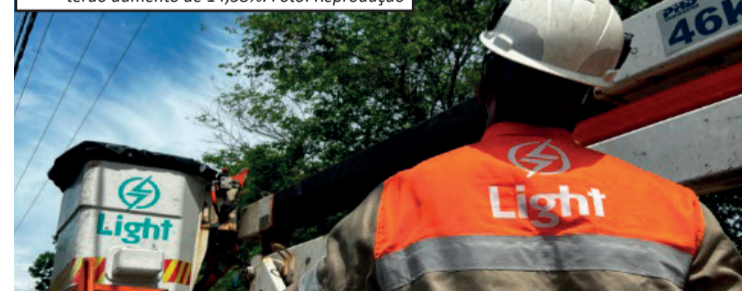
Reajuste médio quase dobra e clientes residenciais terão aumento de 14,58%.

A Advocacia-Geral da União informou que vai recorrer da liminar, com o objetivo de restabelecer o modelo anterior e diminuir o impacto no bolso dos consumidores.