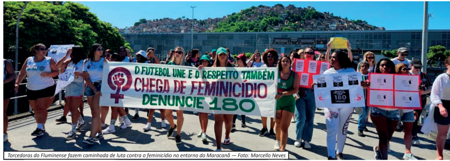
Torcedoras do Fluminense fazem caminhada de luta contra o feminicídio no entorno do Maracanã

Nos últimos anos, clubes e instituições têm adotado medidas para acolher vítimas e prevenir casos de violência, como equipes especializadas nos estádios e campanhas de conscientização.