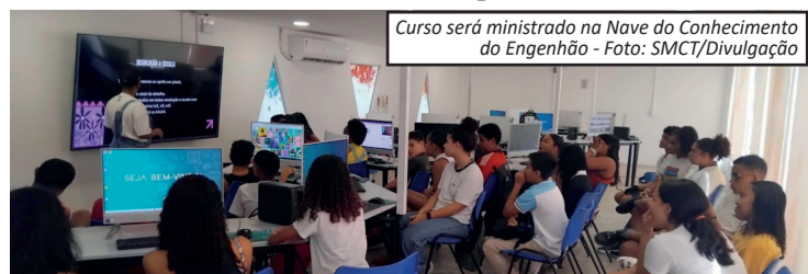
Curso será ministrado na Nave do Conhecimento do Engenhão

tos visuais e sonoros para jogos. Também estão previstas discussões sobre cidadania digital, saúde mental e uso consciente da tecnologia. Para participar, é necessário estar matriculado em uma escola pública da cidade e ter disponibilidade para frequentar as aulas presenciais. As inscrições podem ser feitas até o dia 30 de março pela plataforma da Nave do Conhecimento.