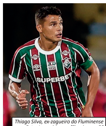
Thiago Silva, ex-zagueiro do Fluminense

Thiago Silva afirmou que sua saída do Fluminense foi planejada com antecedência e não ocorreu de forma repentina, como muitos torcedores imaginaram após sua transferência para o FC Porto. O zagueiro revelou que comunicou a decisão à diretoria cerca de dois meses antes de deixar o clube, permitindo tempo para reposição no elenco. Segundo