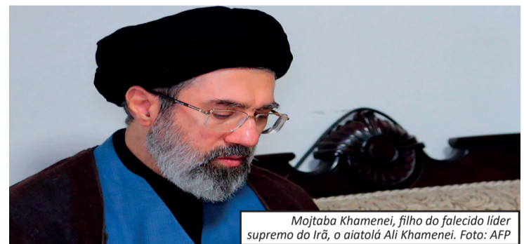
Mojtaba Khamenei, filho do falecido líder supremo do Irã, o aiatolá Ali Khamenei.

O novo líder supremo do Irã, Mojtaba Khamenei, teria sido ferido no ataque que matou seu pai, Ali Khamenei, segundo o jornal The New York Times. O bombardeio ocorreu em 28 de fevereiro durante ofensiva de Estados Unidos e Israel. Autoridades iranianas dizem