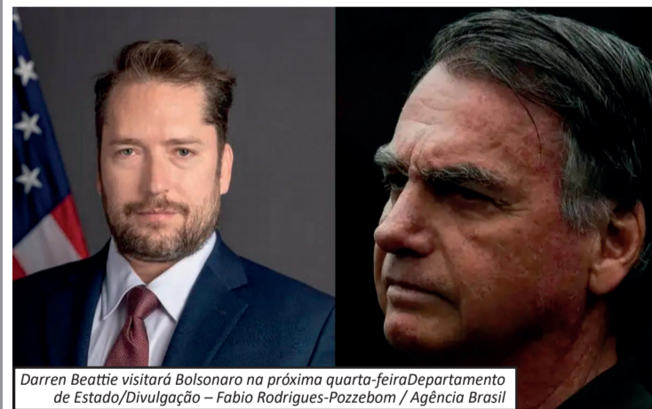
Darren Beattie visitará Bolsonaro na próxima quarta-feira

que ele sofreu ferimentos nas pernas mas sobreviveu. Aliados afirmam que está em local seguro com comunicação restrita. A sucessão gerou disputa política no país. O presidente Donald Trump disse que Washington deveria influenciar a escolha do novo líder iraniano no futuro.