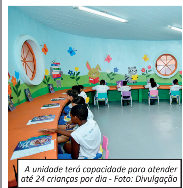
A unidade terá capacidade para atender até 24 crianças por dia

Podem se inscrever famílias com gestantes, crianças de até 6 anos e seus cuidadores, principalmente aquelas em situação de vulnerabilidade socioeconômica, beneficiárias de programas de transferência de renda ou com histórico de fragilização de vínculos familiares.