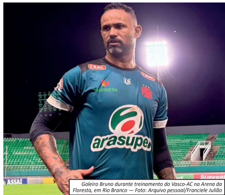
Goleiro Bruno durante treinamento do Vasco-AC na Arena da Floresta, em Rio Branco

A Justiça do Rio de Janeiro passou a considerar foragido o ex-goleiro Bruno Fernandes após a expedição de um mandado de prisão pela Vara de Execuções Penais do Tribunal de Justiça do Rio de Janeiro. A decisão foi tomada depois que o ex-jogador deixou de cumprir uma das condições impostas durante a liberdade condicional. Segundo o tribunal, Bruno não se apresentou para atender à determinação judicial que exigia o retorno ao regime semiaberto, o que levou à