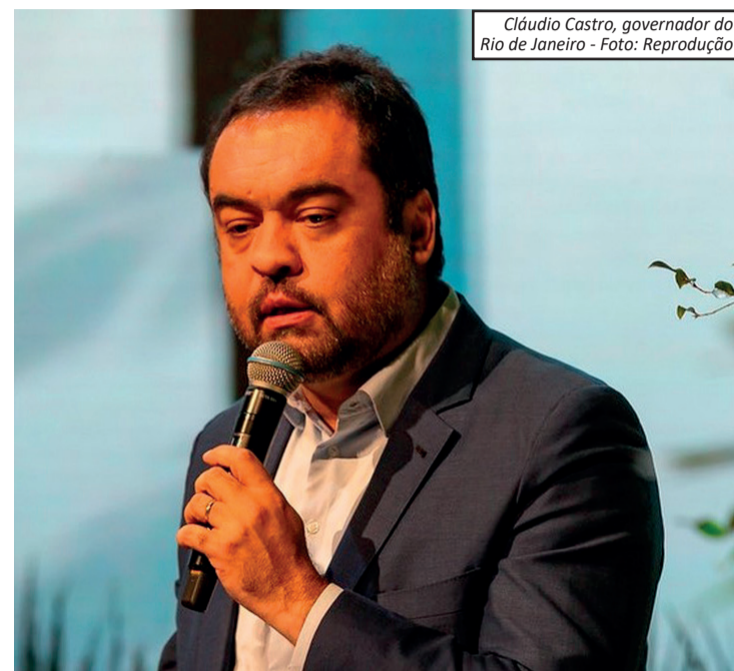
Cláudio Castro, governador do Rio de Janeiro

No TSE, o julgamento começou em novembro do ano passado com o voto da relatora, a ministra Isabel Gallotti, que se posicionou pela cassação do mandato do governador e pela realização de novas eleições, além da inelegibilidade dos envolvidos. Com o novo pedido de vista, outros seis ministros da Corte ainda precisam votar. O tribunal decidirá se rejeita os recursos ou se determina a cassação dos mandatos e a aplicação das sanções eleitorais.