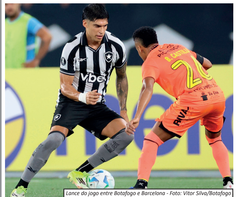
Lance do jogo entre Botafogo e Barcelona

O Botafogo de Futebol e Regatas está fora da Copa Libertadores da América de 2026. O time carioca foi derrotado por 1 a 0 pelo Barcelona Sporting Club na noite de terça-feira (10), em casa, no Estádio Nilton Santos, no jogo de volta da terceira fase preliminar da competição. Mesmo com maior posse de bola e número superior de finalizações, o Botafogo não conseguiu transformar o domínio em gols. A equipe equatoriana, por outro lado, aproveitou uma das poucas oportunidades que teve na partida. O gol da vitória foi marcado ainda no primeiro tempo. Aos oito minutos, Rojas