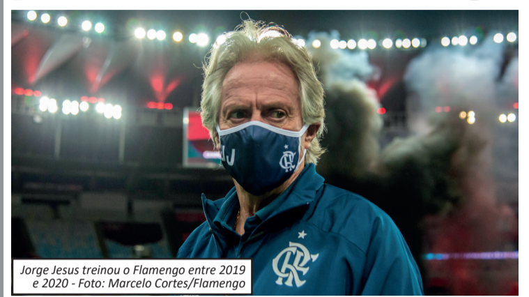
Jorge Jesus treinou o Flamengo entre 2019 e 2020

O técnico português Jorge Jesus afirmou que provavelmente ainda estaria no Flamengo caso a pandemia de COVID-19 não tivesse ocorrido. Atualmente no comando do Al-Nassr, o treinador relembrou sua passagem pelo clube carioca em entrevista ao jornal português Record. Jesus destacou a dimensão do Rubro-Negro e a força de sua torcida, que ele considera uma das maiores do mundo. Segundo o treinador, o tamanho do clube traz também um alto nível de cobrança por resultados, especialmente pela disputa histórica com o Palmeiras em títulos no futebol brasileiro. Durante a entrevista, o técnico também recordou o relacionamento próximo com o elenco do Flamengo. Ele contou que os jogadores demonstravam grande interesse em entender as estratégias e métodos aplicados nos treinamentos, o que resultava em conversas frequentes dentro de campo para explicar detalhes táticos.