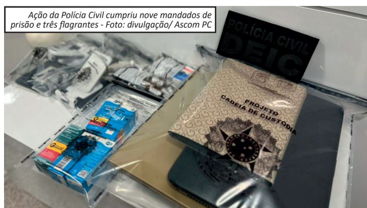
Ação da Polícia Civil cumpriu nove mandados de prisão e três flagrantes

principalmente em forma de canetas injetáveis. Batizada de Operação Peptídeos, a ofensiva cumpriu nove mandados de prisão e realizou três prisões em flagrante. A ação ocorreu em vários bairros de Salvador, como Valéria, Cajazeiras, Canabrava, Ondina, Barra, Pituba, Caminho das Árvores e Costa Azul.