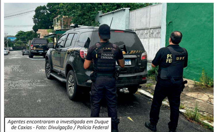
Agentes encontraram a investigada em Duque de Caxias

Uma mulher de 33 anos foi presa nesta terça-feira (10) em Duque de Caxias sob suspeita de cometer abusos sexuais contra as próprias filhas, de 4 e 9 anos, e divulgar os registros dos crimes pela internet.