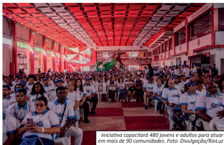
Iniciativa capacitará 480 jovens e adultos para atuar em mais de 90 comunidades.