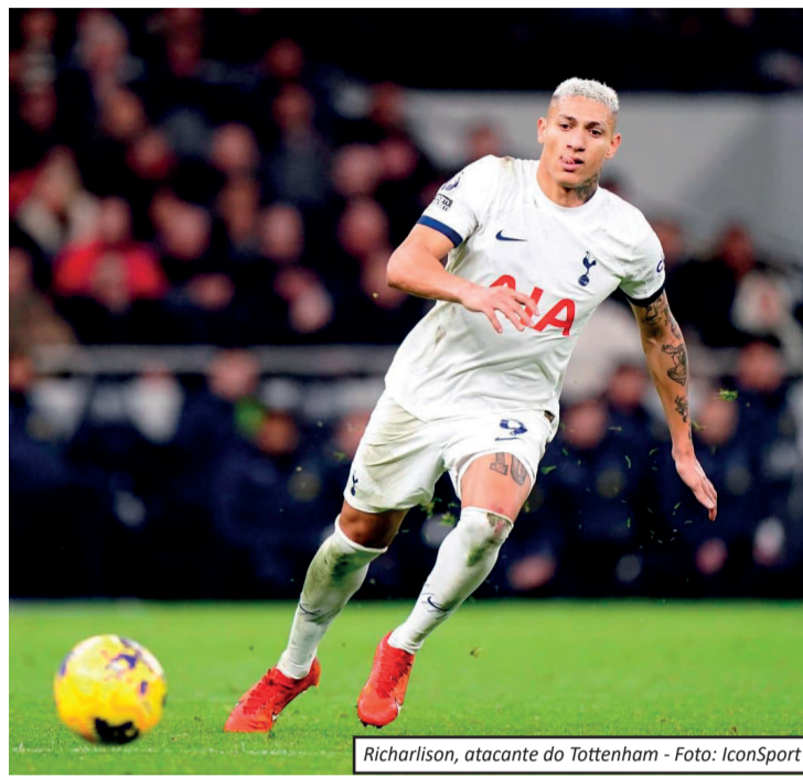
Richarlison, atacante do Tottenham

observados pelo Flamengo. O atacante, de 28 anos, tem experiência no futebol europeu e passagens pela Seleção Brasileira de Futebol, características que se encaixam no perfil buscado pelo clube carioca para reforçar o setor ofensivo. Apesar do interesse, uma eventual negociação ainda é considerada complexa. O jogador tem contrato com o Tottenham até junho de 2027, além de receber um salário elevado para os padrões do futebol brasileiro. Outras opções no mercado Enquanto acompanha o cenário envolvendo Richarlison, o Flamengo também analisa outros nomes para o